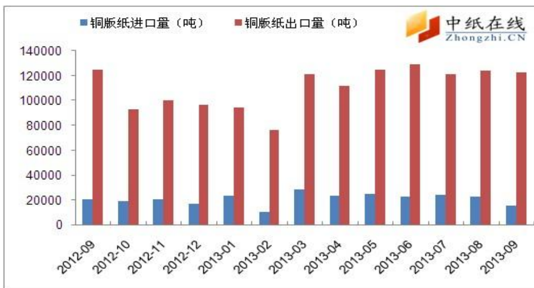
图 7: 铜版纸进出口量对比图

2013年9月铜版纸出口量为122573.19吨,环比减少1760.21吨,减幅为1.42%;同比减少1961.26吨,减幅为1.58%,出口均价约为899美元/吨,环比上涨20美元/吨,涨幅为2.28%;同比下跌68美元/吨,跌幅达7.03%。