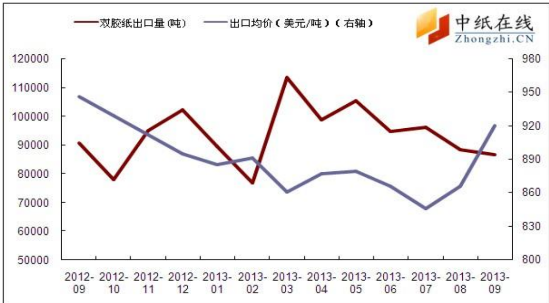
图 3: 双胶纸出口情况

2013年9月国内双胶纸进口量17043.113吨,同比增加2487.86吨,增幅为17.09%,环比增加2608吨,增幅为18.07%。进口均价约1179美元/吨,环比下跌610美元/吨,跌幅达34.10%;同比下跌67美元/吨,跌幅达5.38%。