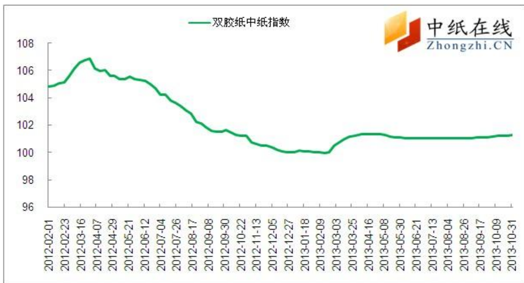
图 8：双胶纸中纸指数（CPPI）走势图