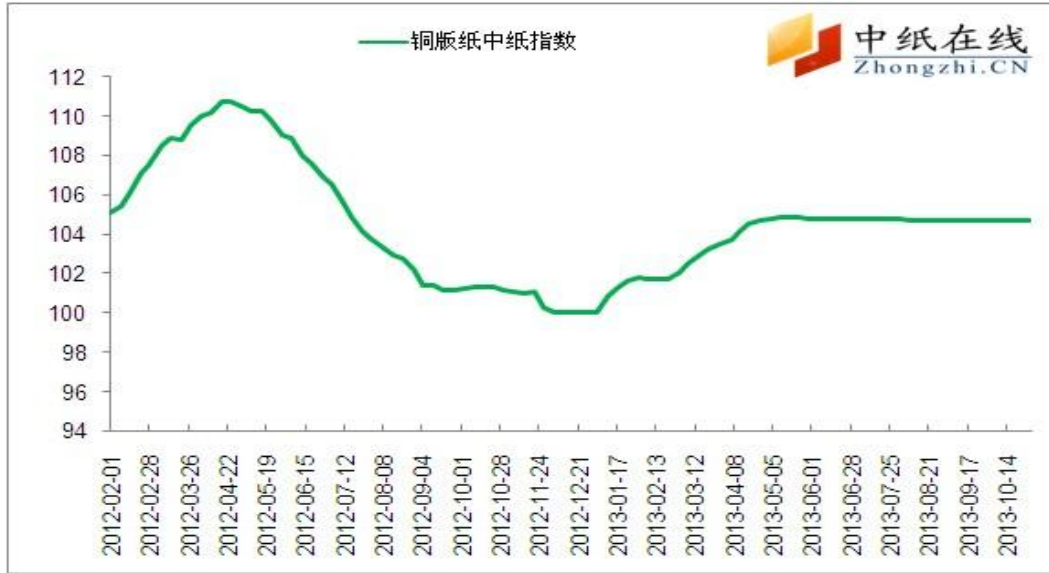
图 9：铜版纸中纸指数（CPPI）走势图