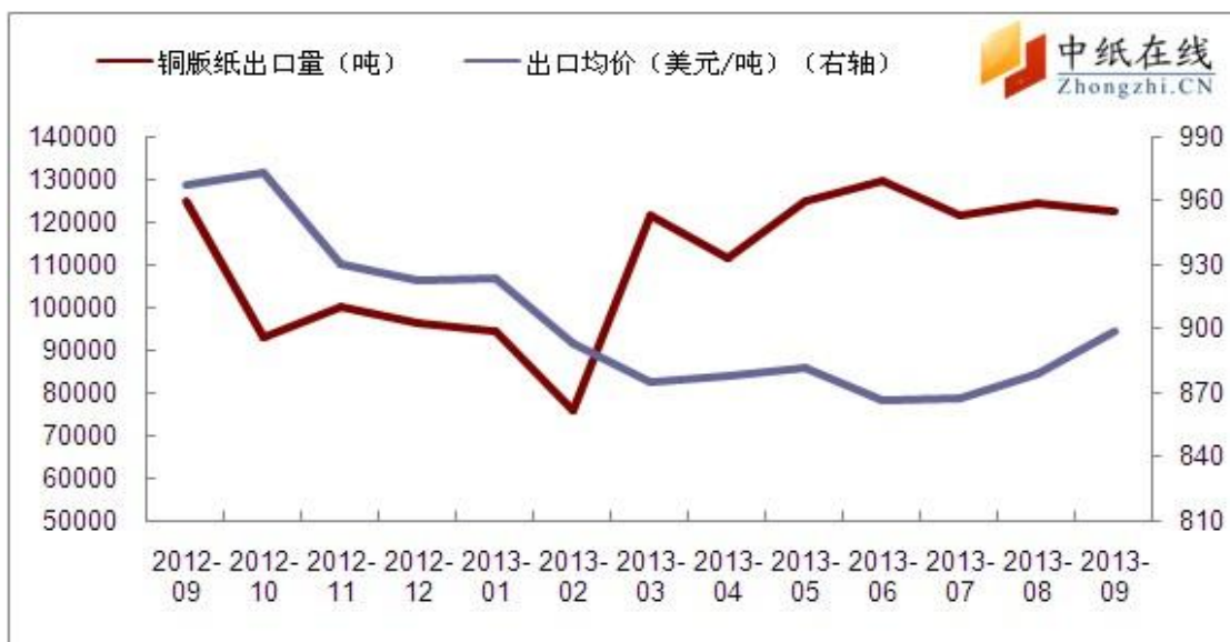
图 6: 铜版纸出口情况