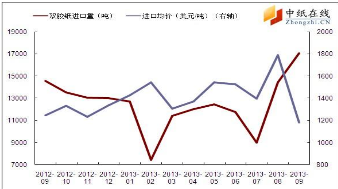
图 2: 双胶纸进口情况