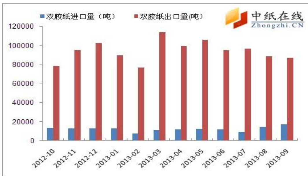
图 4: 双胶纸进出口量对比图