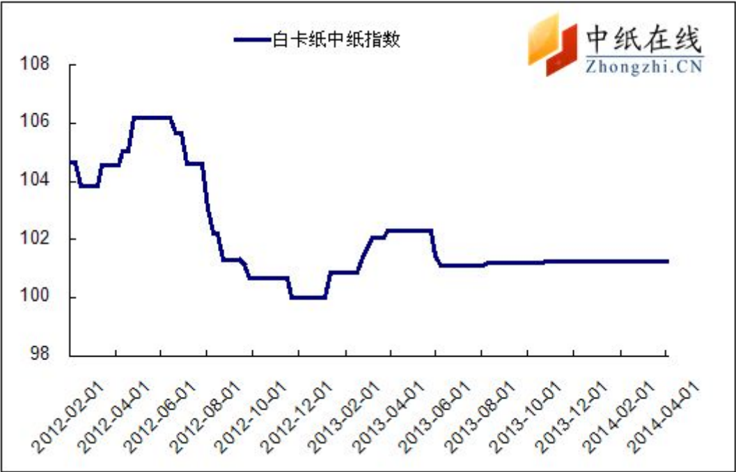
图 1：白卡纸中纸指数走势图

2014年4月04日白卡纸价格指数为101.22,与上周持平,较周期内最高点106.02（2012-5-2）下降了4.98%。