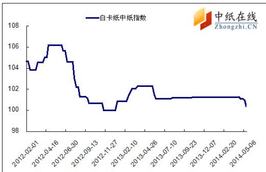
图 1：白卡纸中纸指数走势图

2014 年 5 月 16 日白卡纸价格指数为 100.37，与上周比下降 0.56，较周期内最高点 106.02 点（2012- 5-2）下降了 3.91%。