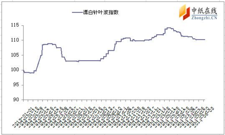
图 1：漂白针叶浆价格指数 2013-1-1 至 2014-6-6

2014年6月6日漂白针叶浆价格指数为110.25,较上周微幅上扬,较周期内最高点114.20下降3.46%。 基期的加权平均值为4654.89元/吨。