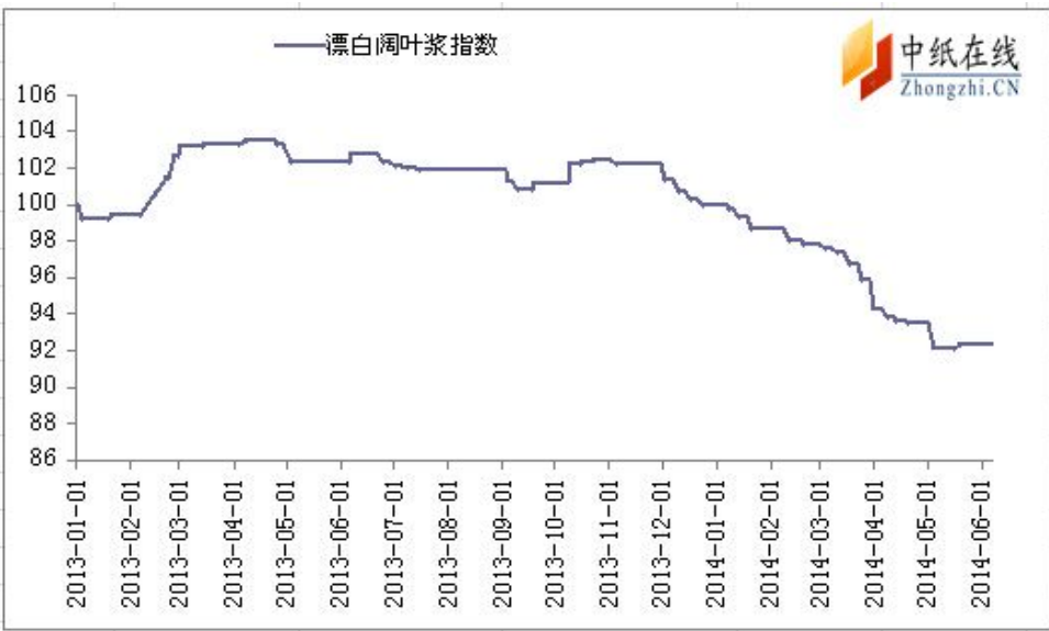
图 2：漂白阔叶浆价格指数 2013-1-1 至 2014-6-6

2014年6月6日漂白阔叶浆价格指数为92.30,与上周持平,较周期内最高点103.92降低了11.18%。 基期的加权平均值为4539.40元/吨。