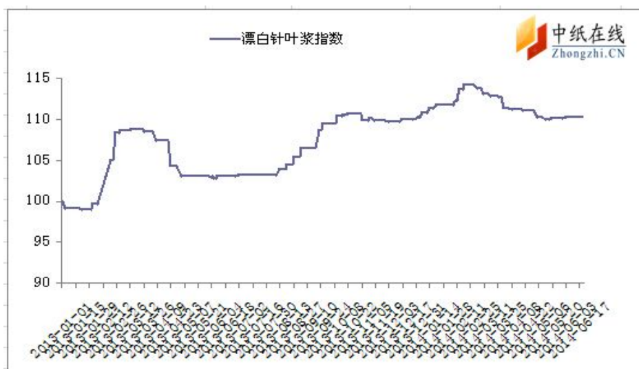
图 1：漂白针叶浆价格指数 2013-1-1 至 2014-6-20

2014年6月20日漂白针叶浆价格指数为110.25,与上周基本持平,较周期内最高点114.20下降3.46%。 基期的加权平均值为4654.89元/吨。