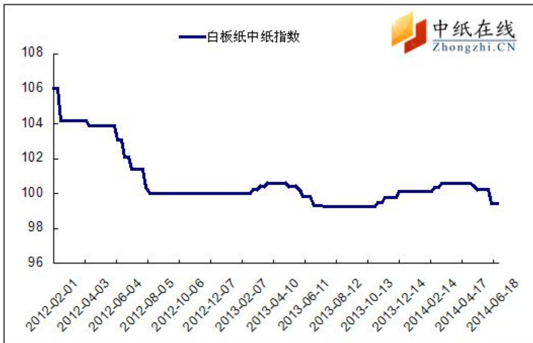
图 1：白板纸中纸指数走势图

2014年6月27日白板纸价格指数为99.46，与上周持平，较周期内最高点106.02（2012-2-1）下降了6.56%。