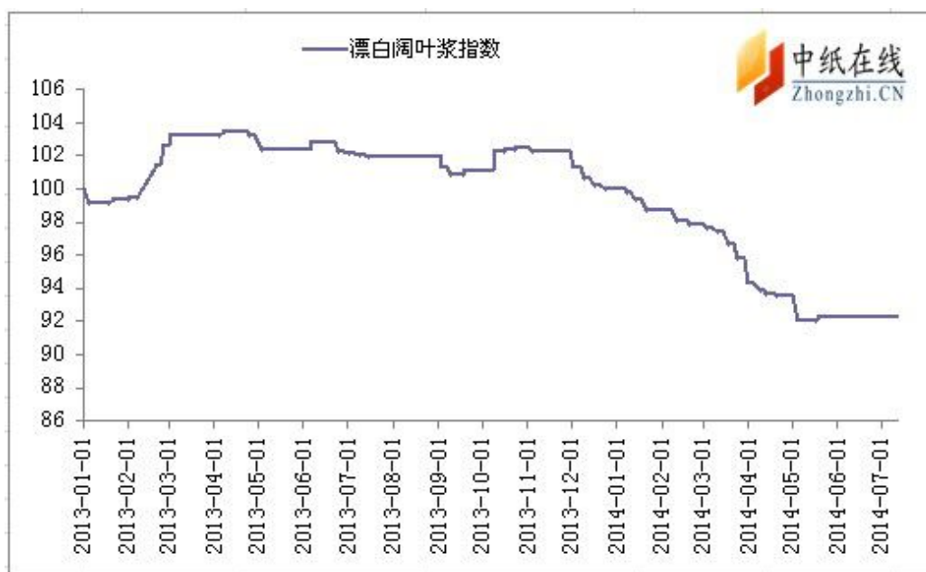
图 2：漂白阔叶浆价格指数 2013-1-1 至 2014-7-11