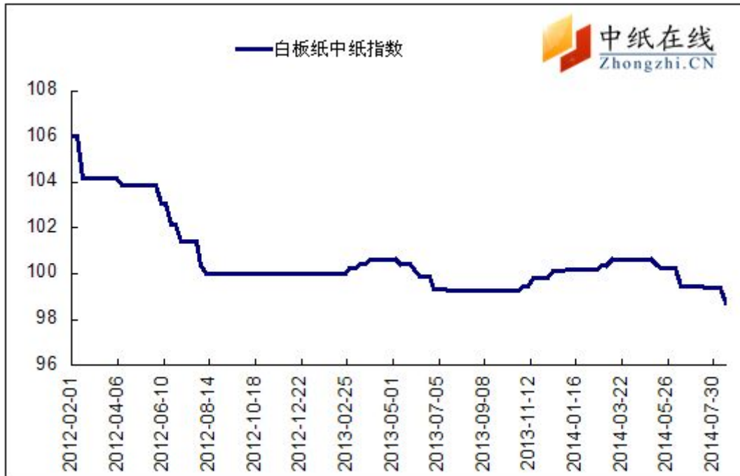
图 1: 白板纸中纸指数走势图

2014年8月15日白板纸价格指数为98.72,与上周比下降0.66,较周期内最高点106.02(2012-2-1)下降了7.30%。