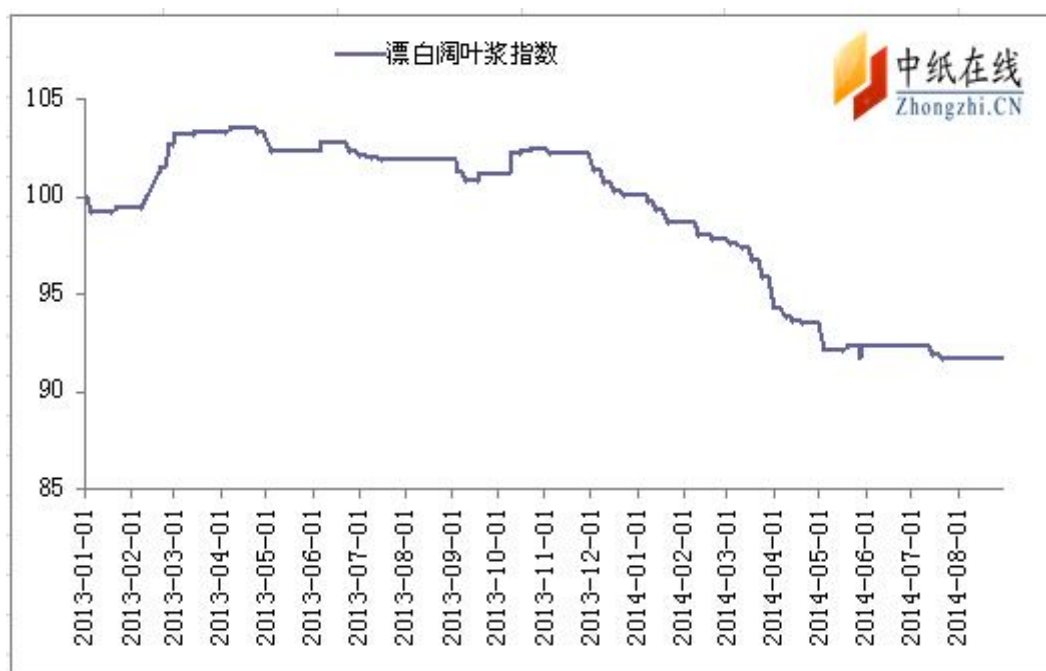
图2：漂白阔叶浆价格指数 2013-1-1 至 2014-8-31

2014年8月31日漂白阔叶浆价格指数为91.64，与上周基本持平，较周期内最高点103.92降低了11.82%。基期的加权平均值为4539.40元/吨。