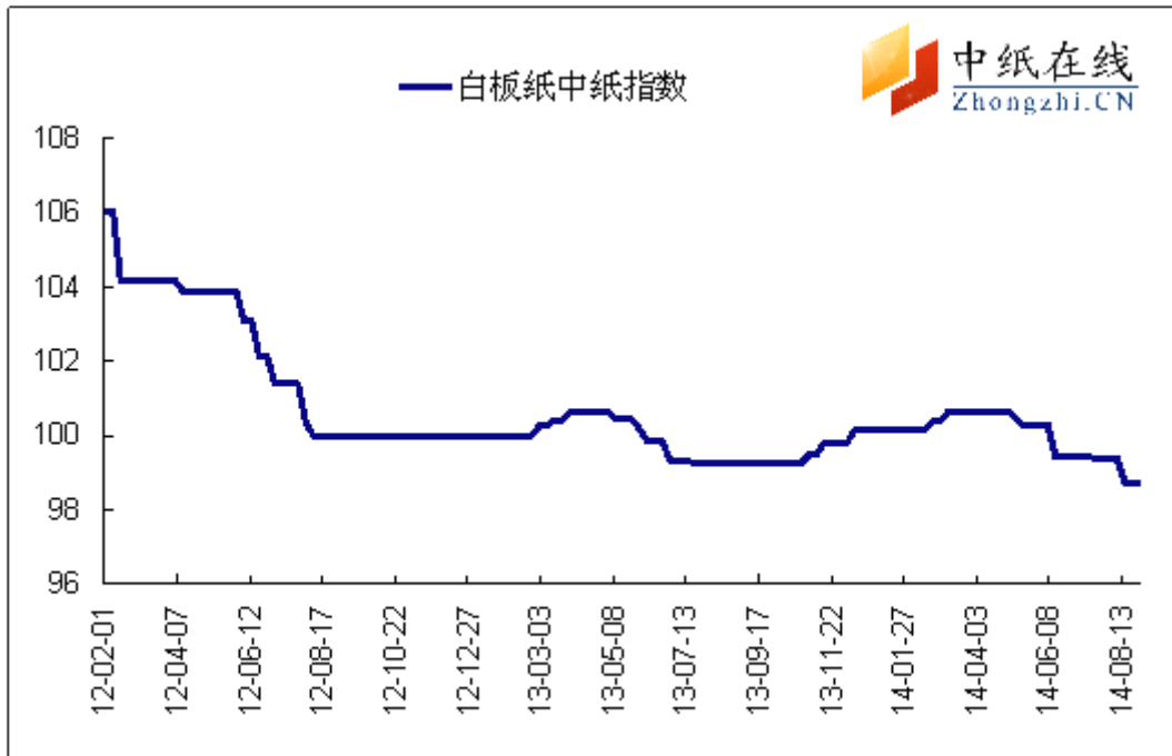
图 1: 白板纸中纸指数走势图

2014年8月29日白板纸价格指数为98.72,与上周持平,较周期内最高点106.02(2012-2-1)下降了7.30%。