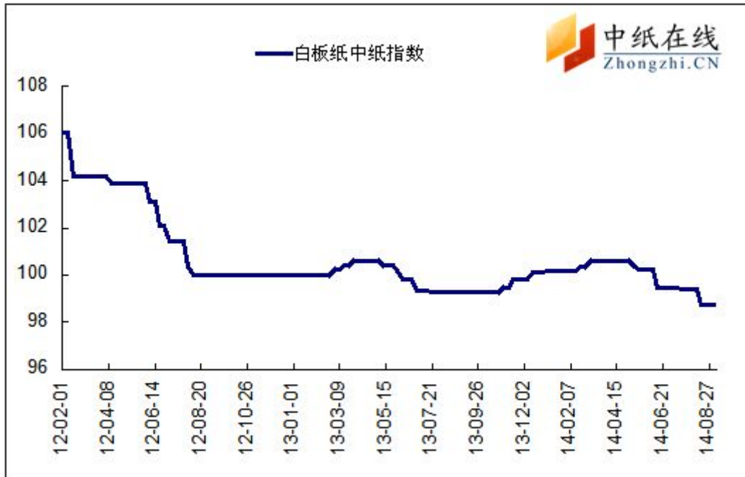
图 1: 白板纸中纸指数走势图

2014年9月5日白板纸价格指数为98.72，与上周持平，较周期内最高点106.02(2012-2-1)下降了7.30%。