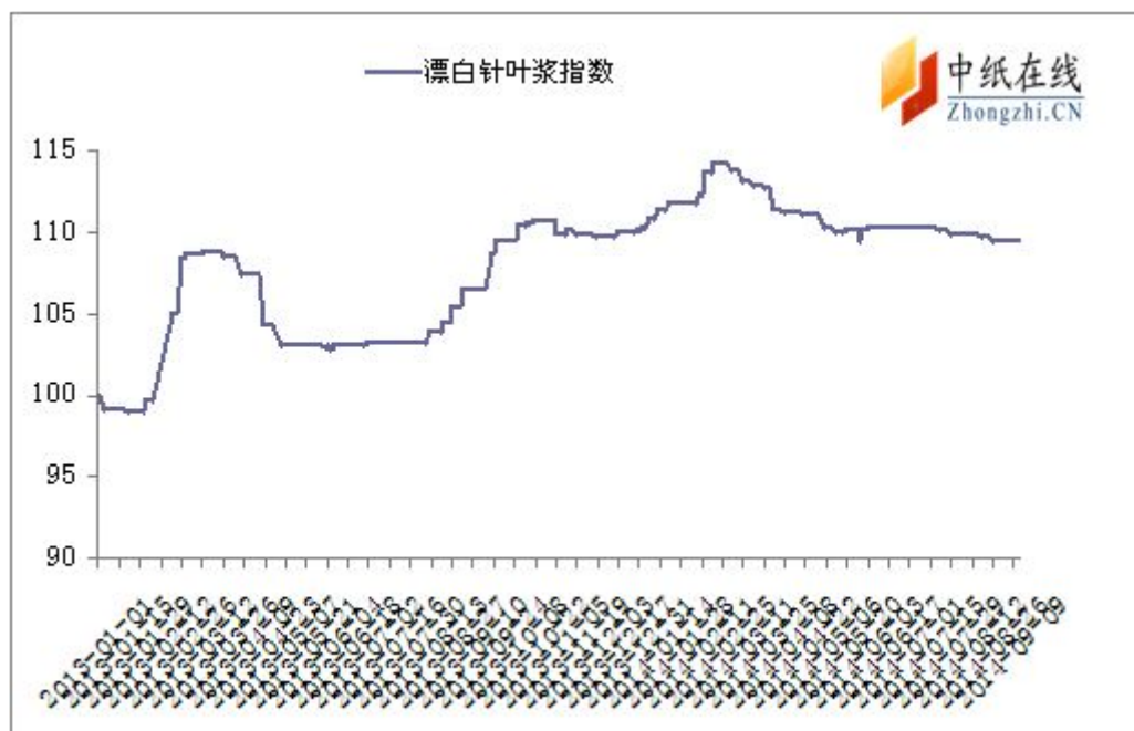
图 1：漂白针叶浆价格指数 2013-1-1 至 2014-9-12

2014 年 9 月 12 日漂白针叶浆价格指数为 109.51，与上周持平，较周期内最高点 114.20 下降 4.1%。 基期的加权平均值为 4654.89 元/吨。