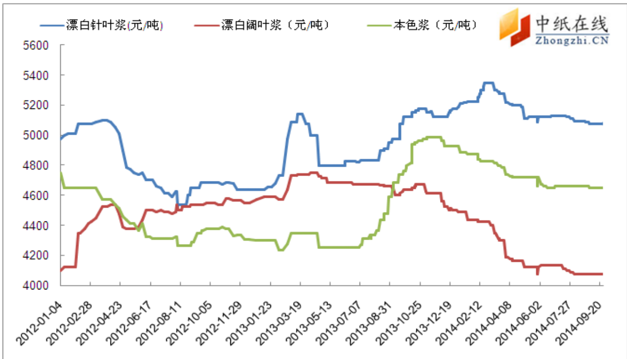
图 3: 国内市场纸浆价格最新走势