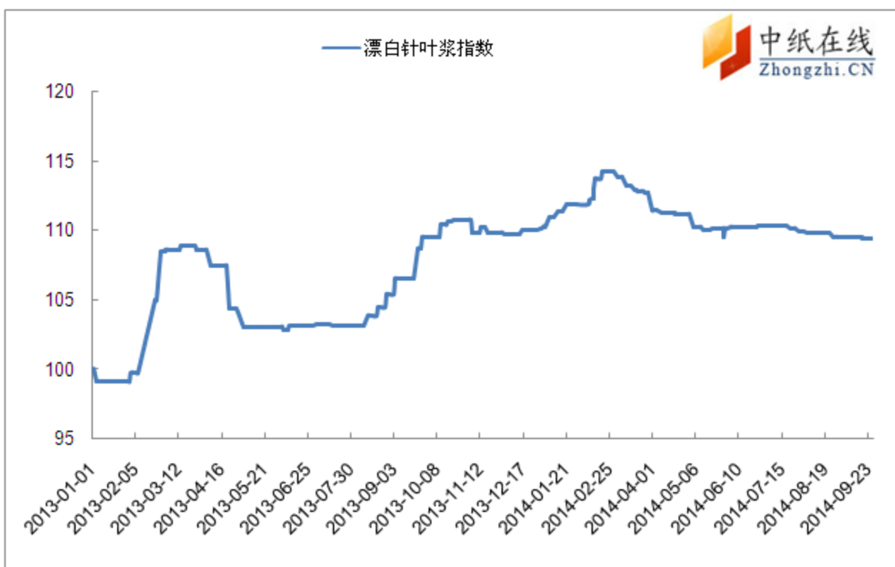
图 1: 漂白针叶浆价格指数

2014 年 9 月 12 日漂白针叶浆价格指数为 109.39, 与上周持平, 较周期内最高点 114.20 下降 4.2%。