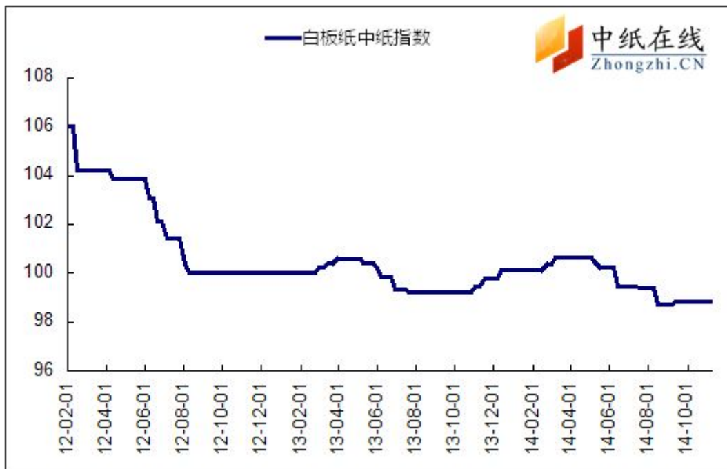
图 1: 白板纸中纸指数走势图

2014年11月07日白板纸价格指数为98.85,与上周持平,较周期内最高点106.02(2012-2-1)下降了7.17%。