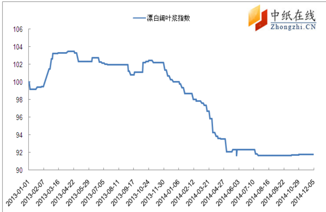
图 2: 进口漂阔浆中纸指数走势图