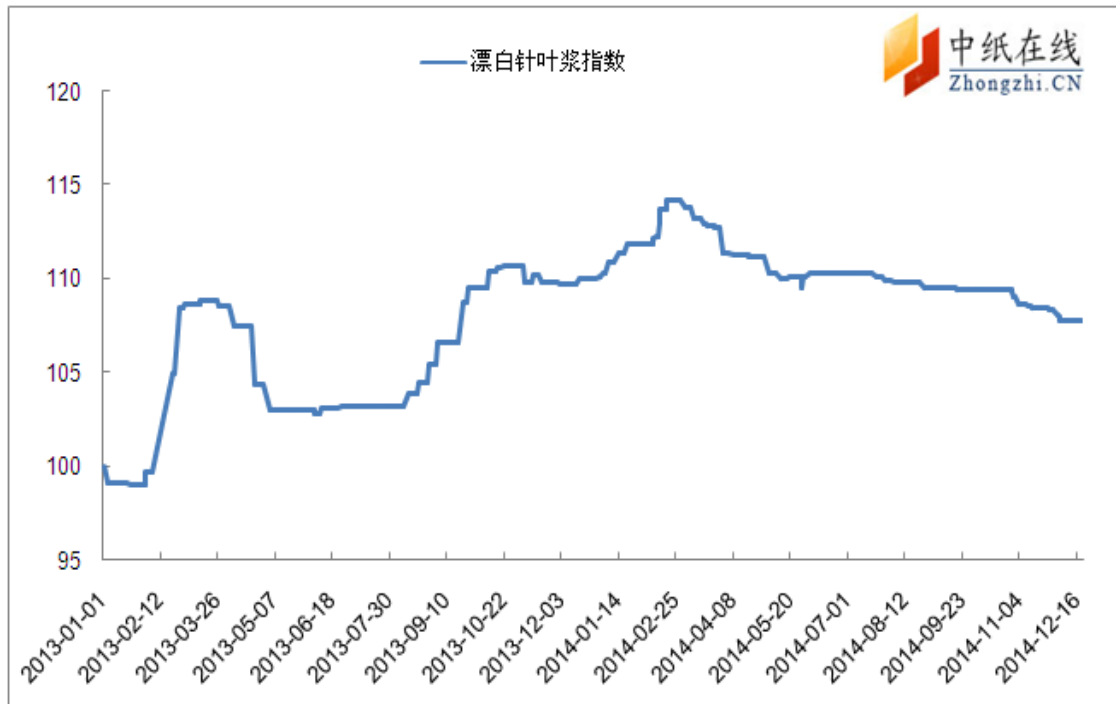
图 1：进口漂针浆中纸指数走势图