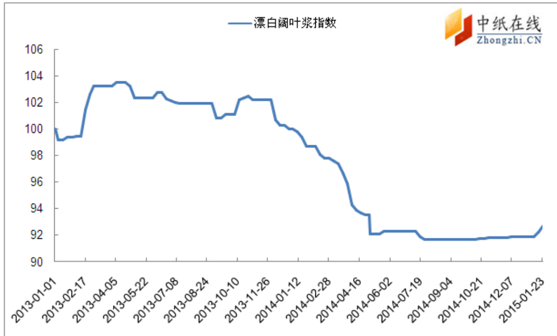
图 2: 进口漂阔浆价格指数走势图