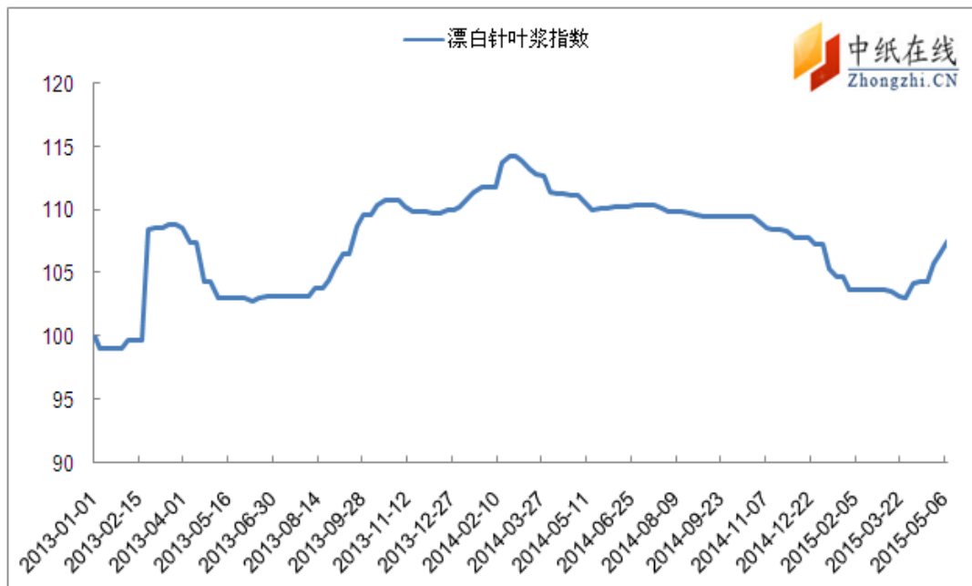
图 1：进口漂针浆价格指数走势图

从中纸指数来看，2015 年 5 月 8 日，漂针浆中纸指数 107.54 点，与上周五比上涨 1.09 点，漂阔浆中纸指数 103.39 点，与上周五比大幅上涨 1.09 点。