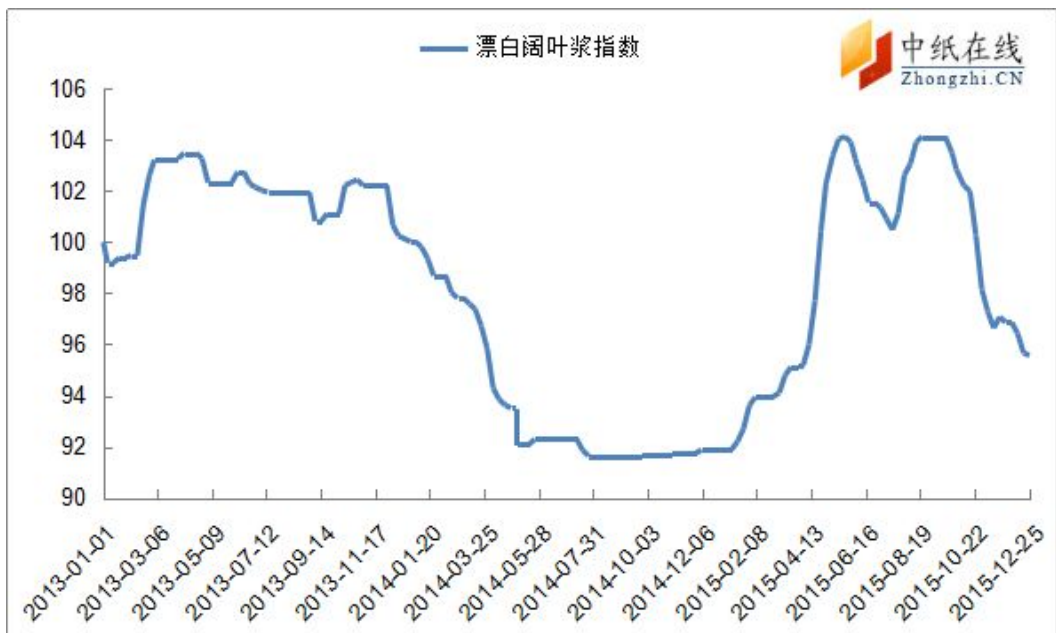
图 2：进口漂阔浆价格指数走势图