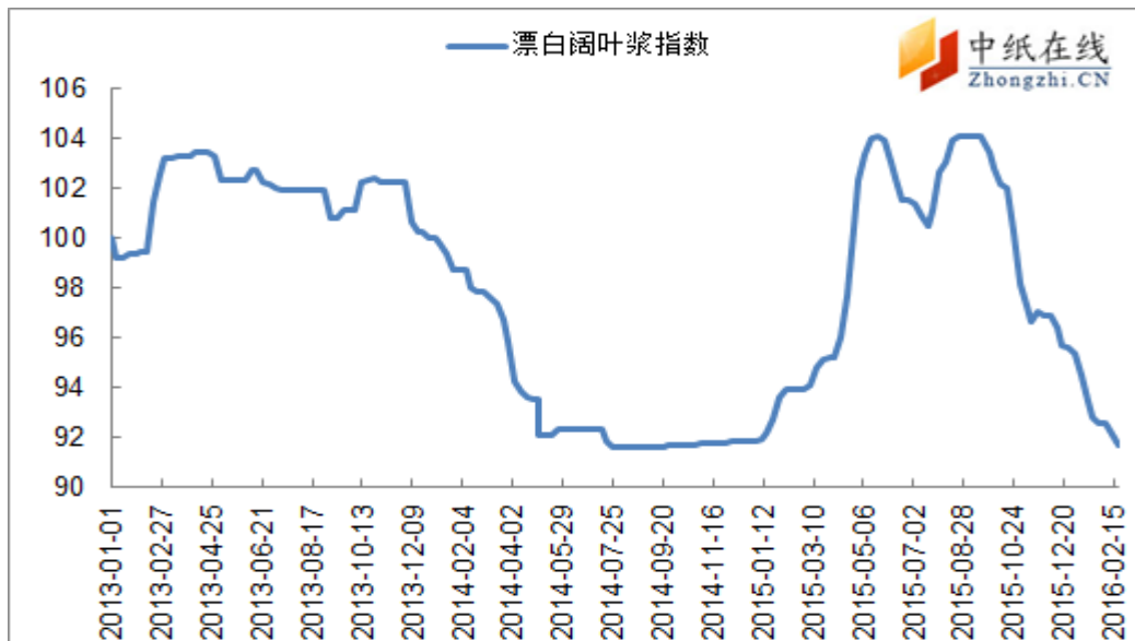
图 2：进口漂阔浆价格指数走势图