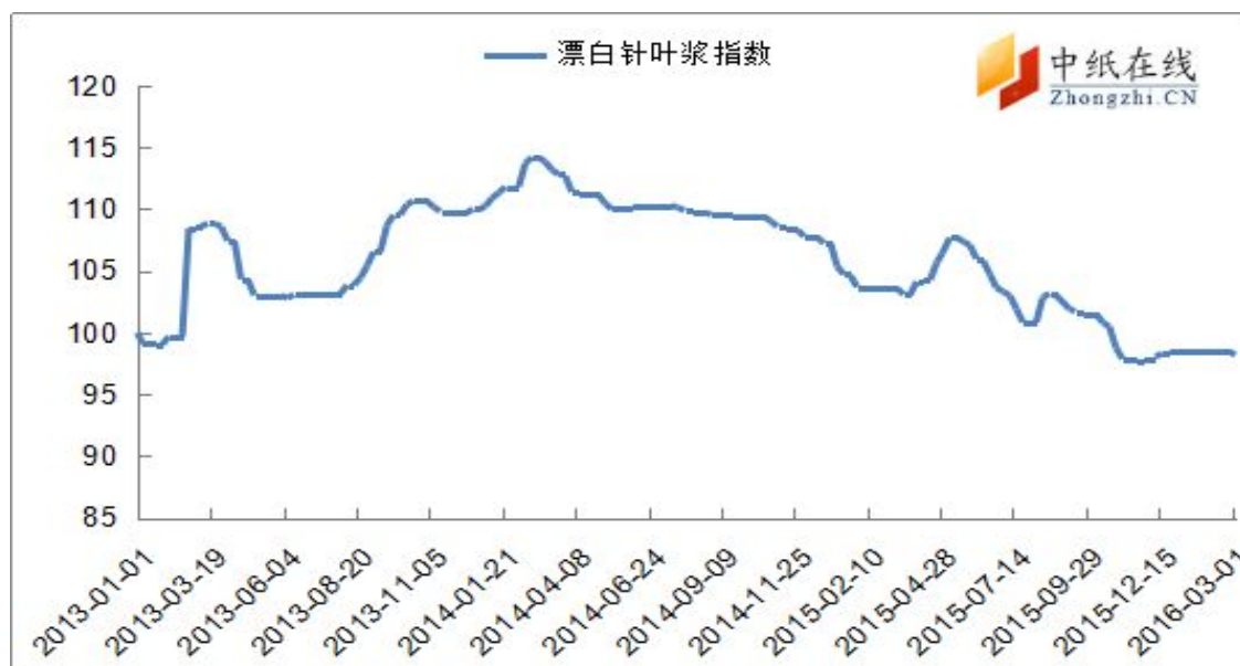
图 1：进口漂针浆价格指数走势图

从中纸指数来看，2016年3月4日，漂针浆中纸指数98.19点，与上周比下降0.31%；漂阔浆中纸指数89.34点，与上周五比下跌1.21%。