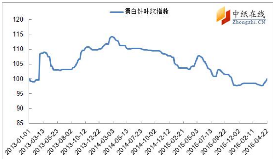
图1：进口漂针浆价格指数走势图

从中纸指数来看，2016年4月22日，漂针浆中纸指数100.04点，与上周比上涨0.94%；漂阔浆中纸指数83.99点，与上周五持平。