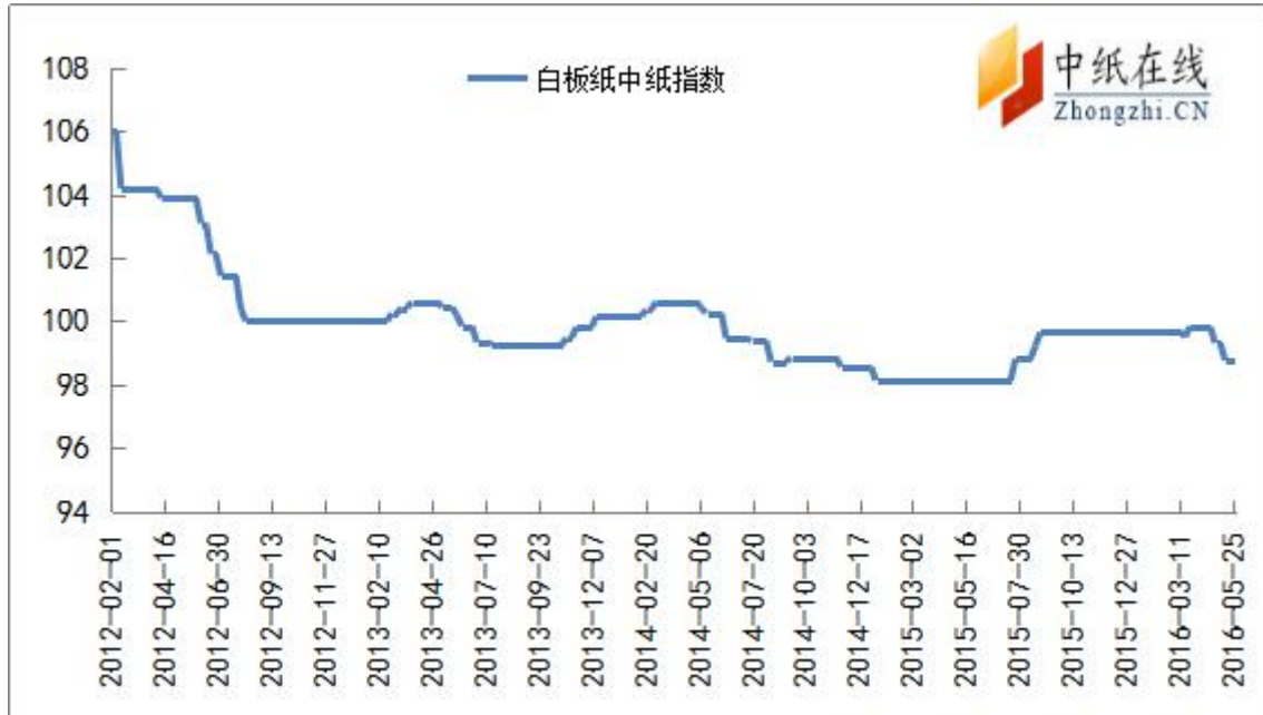
图7：白板纸中纸指数走势图