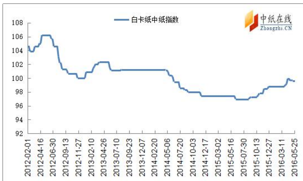
图 5：白卡纸中纸指数走势图