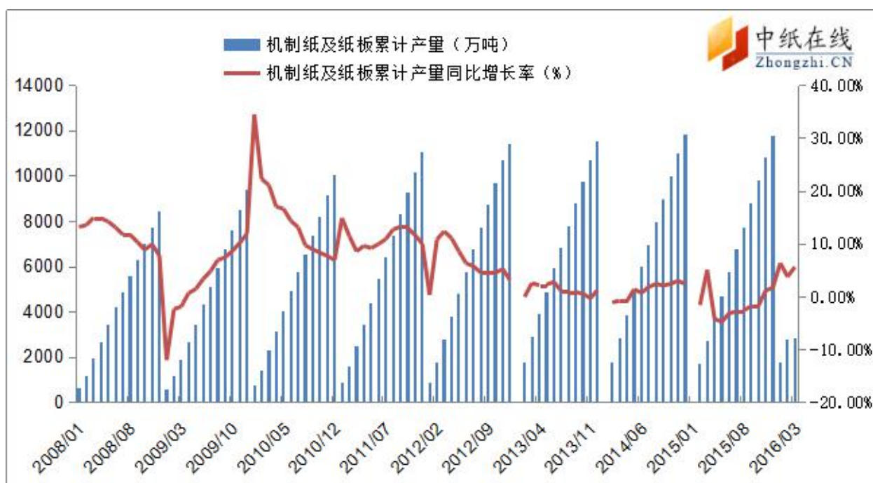
图 1：近年来我国机制纸及纸板产量走势图