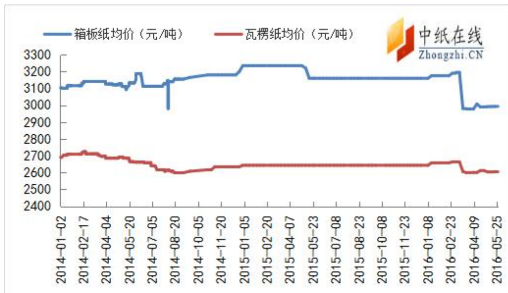
图 9：箱板瓦楞纸出厂均价走势图