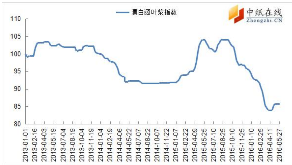
图 8：漂阔浆中纸指数走势图