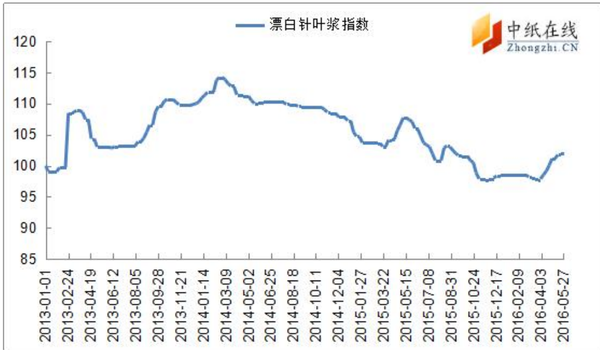
图 7：漂针浆中纸指数走势图