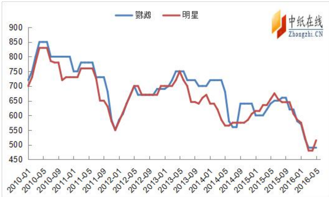
图 6: 2010 年以来阔叶浆报盘走势图 (单位: 美元/吨)