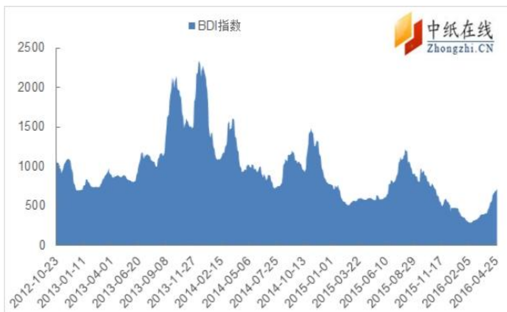
图 6：波罗的海干散货指数走势图