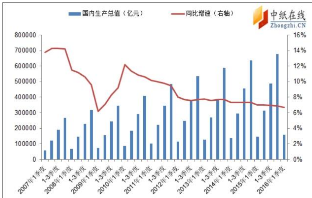
图 3：2007-2016 年我国 GDP 统计图