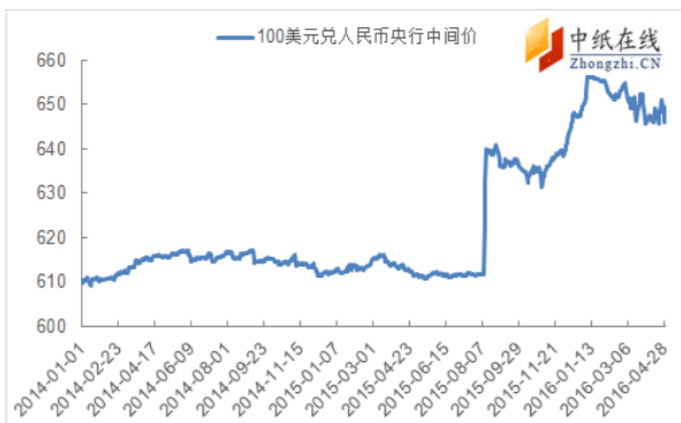
图 5：100 美元兑人民币央行中间价走势图