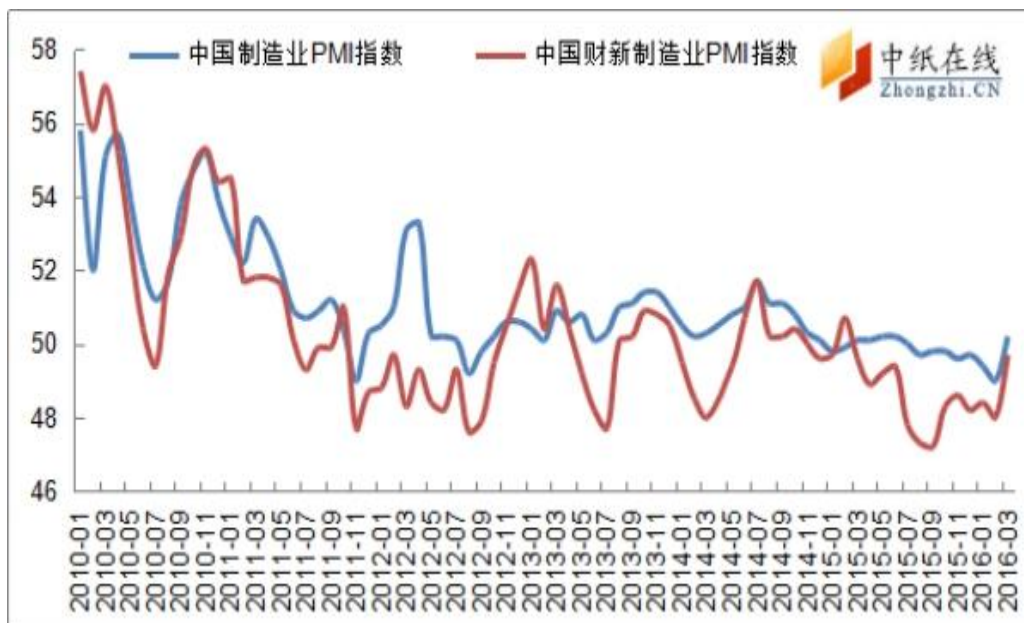
图 4：中国制造业 PMI 指数走势图