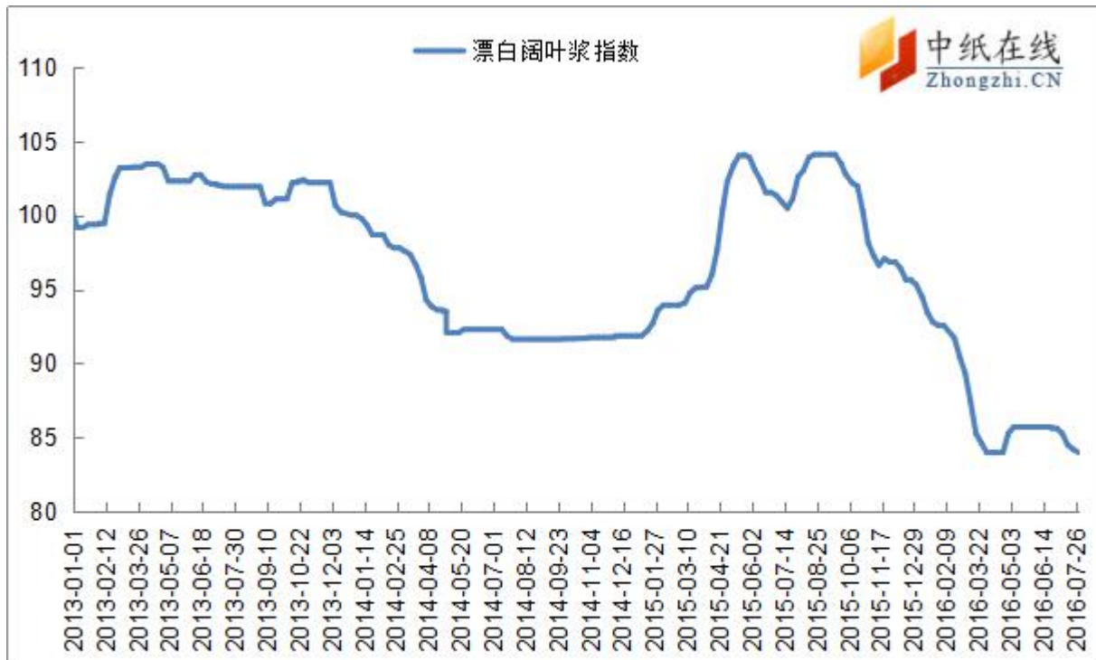
图 8：漂阔浆中纸指数走势图