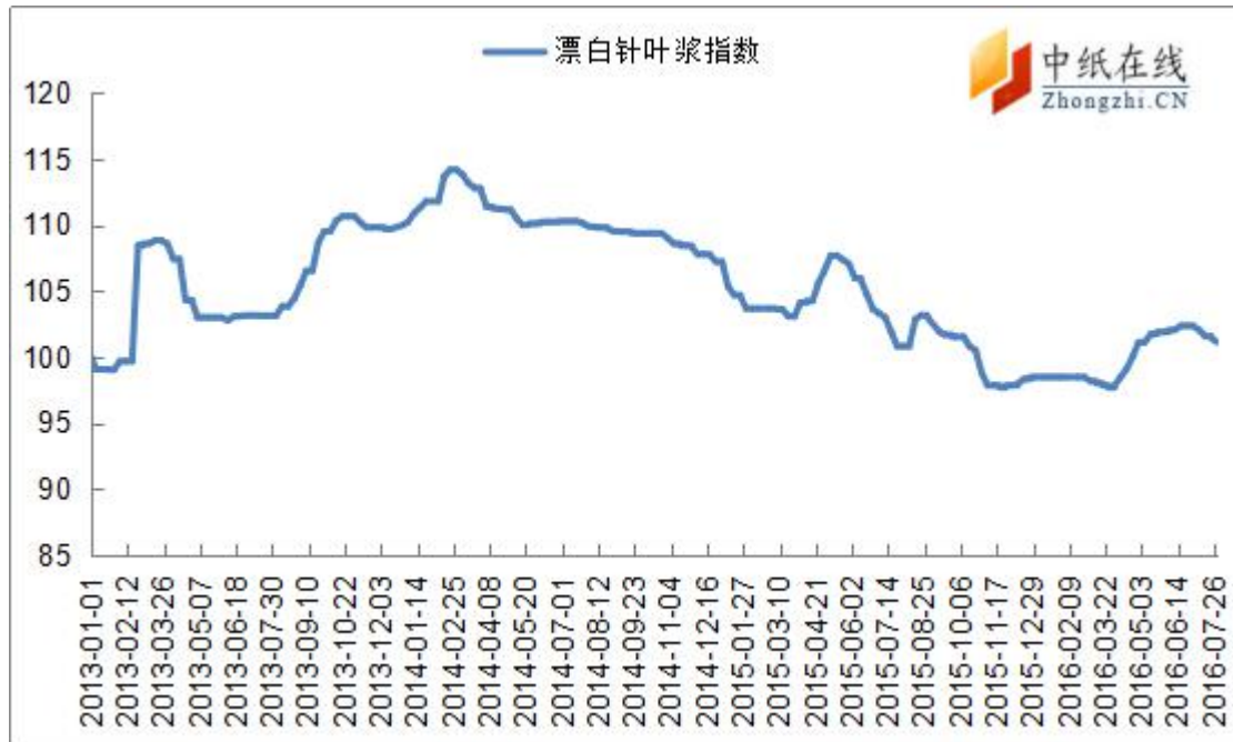
图 7：漂针浆中纸指数走势图