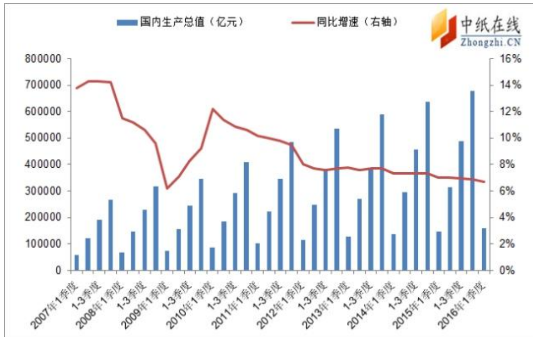
图 3：2007-2016 年我国 GDP 统计图