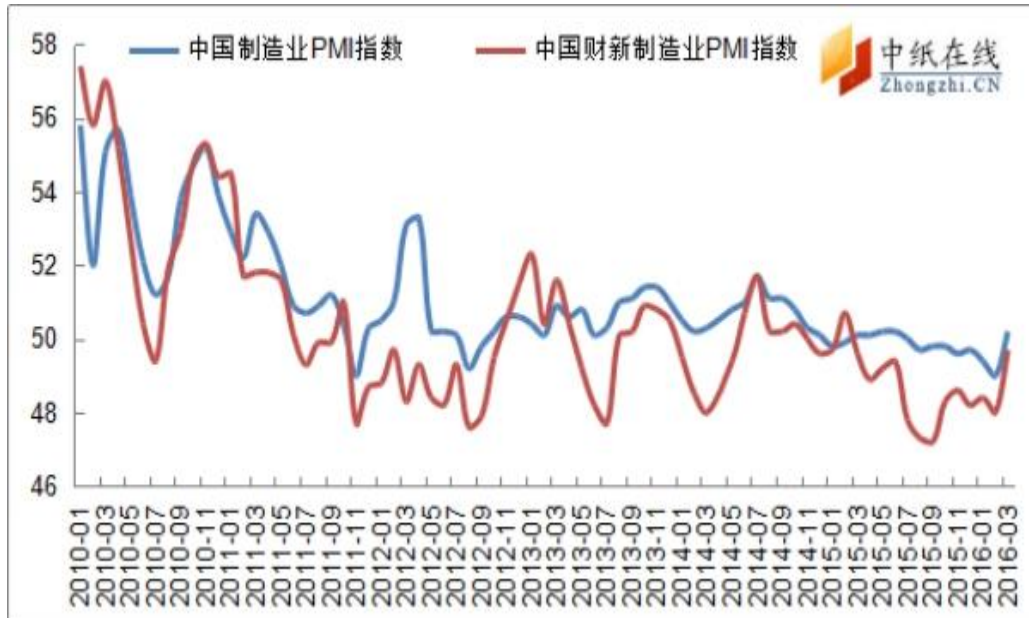
图 4：中国制造业 PMI 指数走势图