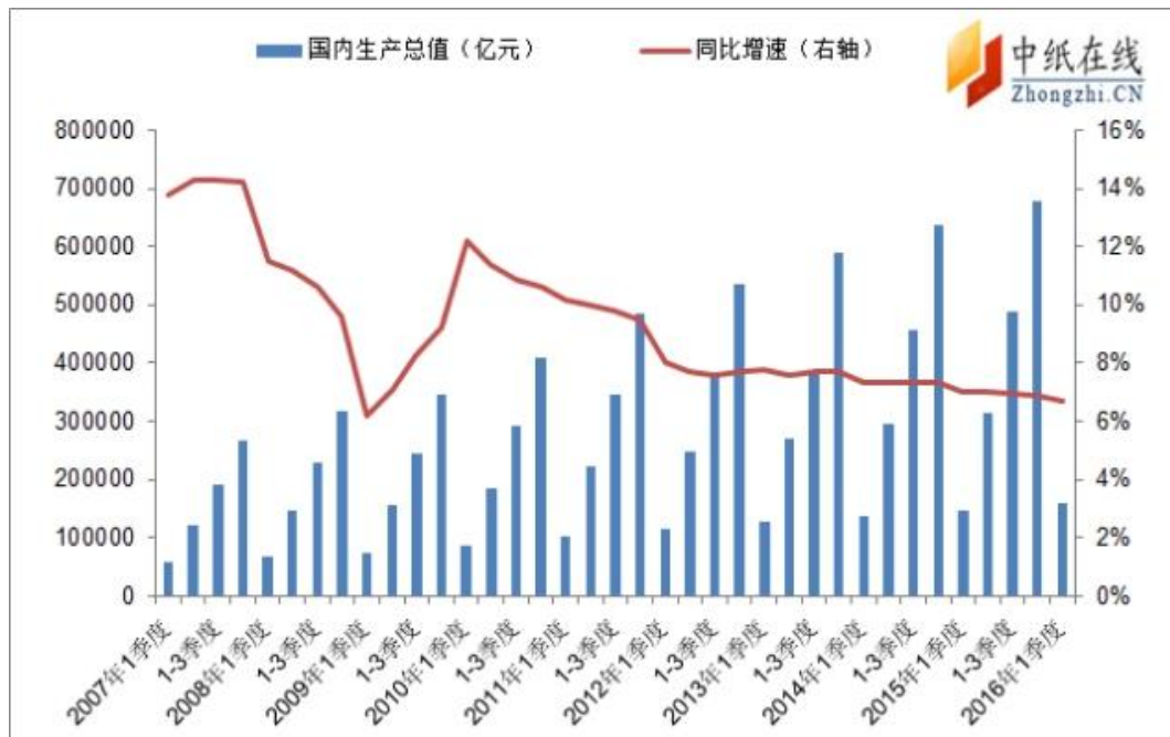
图 3：2007-2016 年我国 GDP 统计图