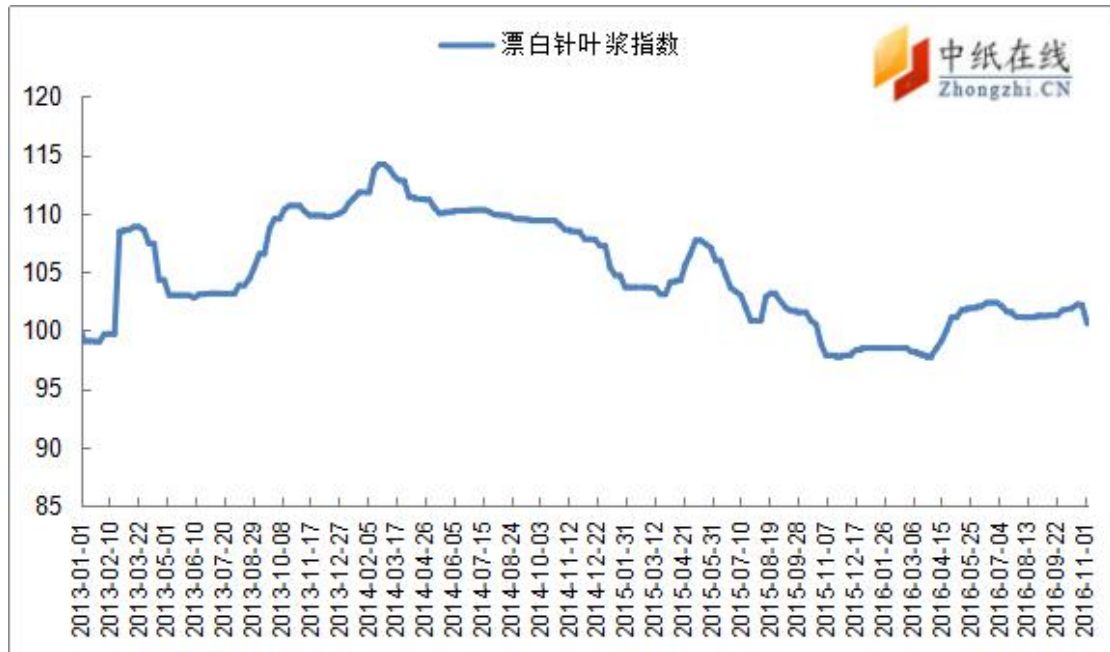
图 1: 进口漂针浆价格指数走势图

从中纸指数来看,2016年11月4日,漂针浆中纸指数100.60点,与10月28日比102.1点相比,下降1.46%;漂阔浆中纸指数86.35点,与10月28日比85.92点相比,上升0.5%。