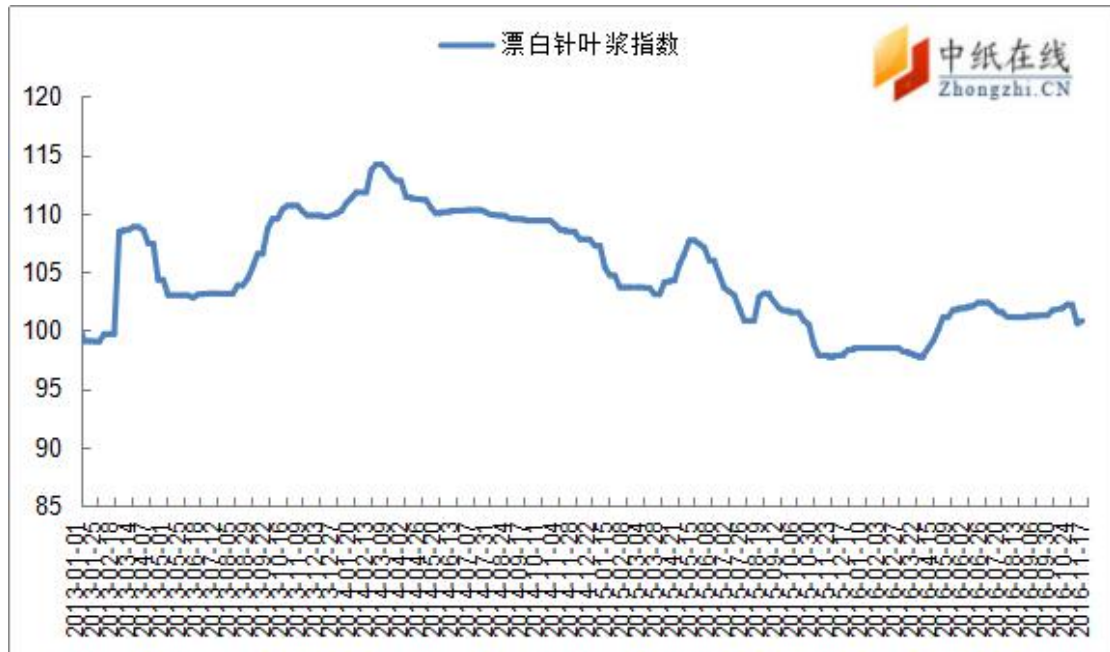
图 1：进口漂针浆价格指数走势图

从中纸指数来看，2016年11月18日，漂针浆中纸指数100.82点，与11月11日比100.82点持平；漂阔浆中纸指数87.85点，与11月11日比86.69点相比，上升1.34%。