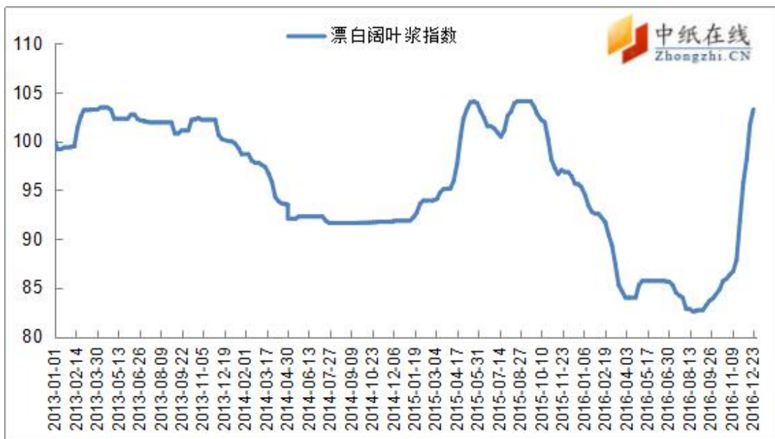
图 2：进口漂阔浆价格指数走势图