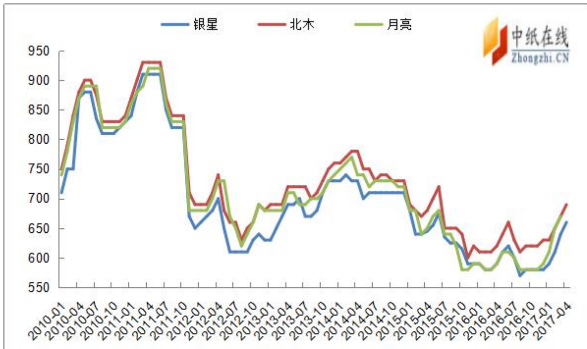
图 5：2010 年以来针叶浆报盘走势图（单位：美元/吨）