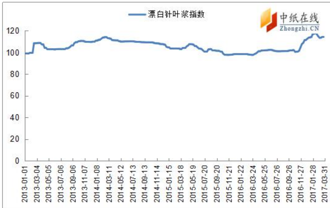
图 7：漂针浆中纸指数走势图