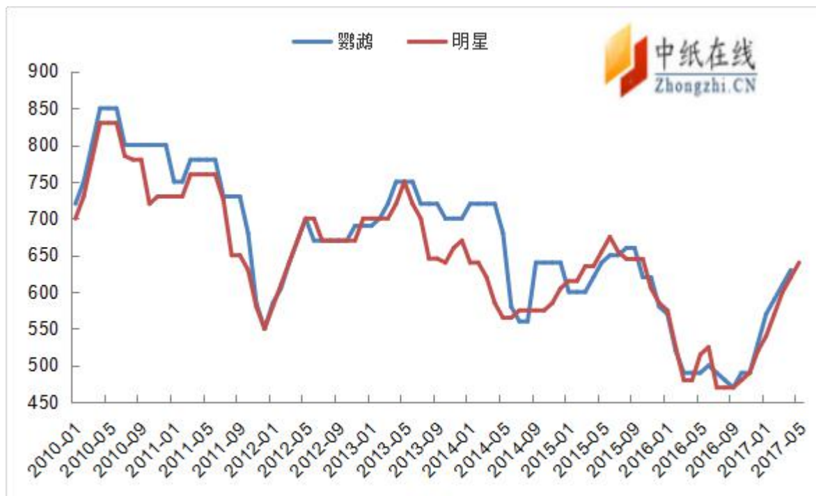
图 6: 2010 年以来阔叶浆报盘走势图 (单位: 美元/吨)