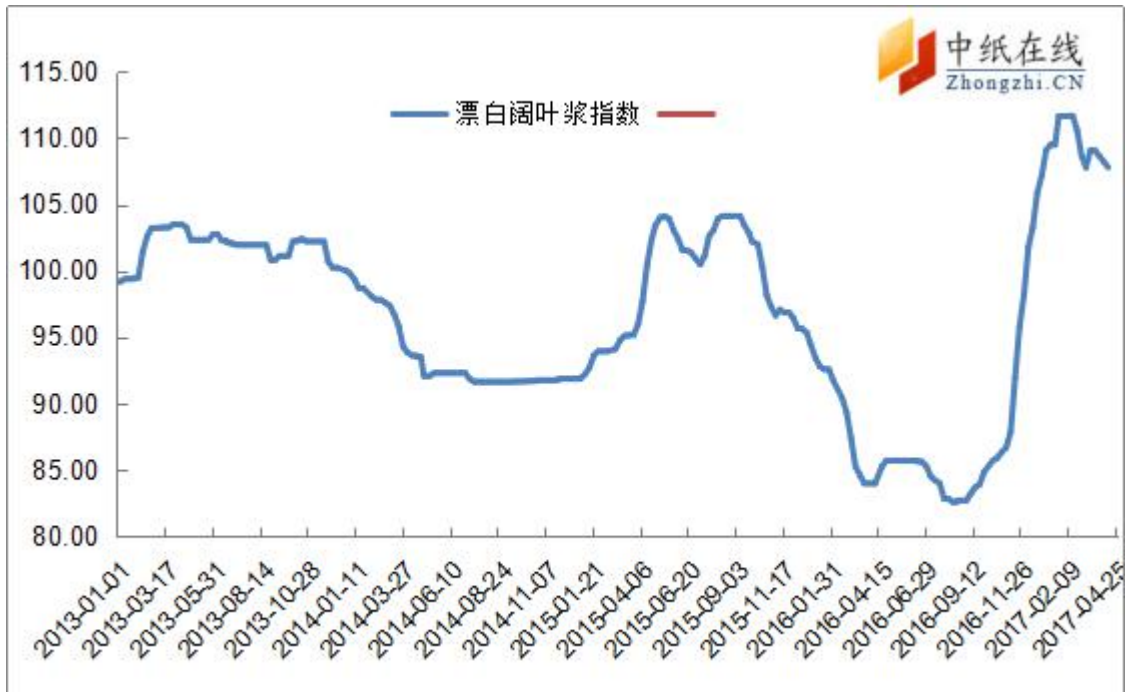
图 8：漂阔浆中纸指数走势图