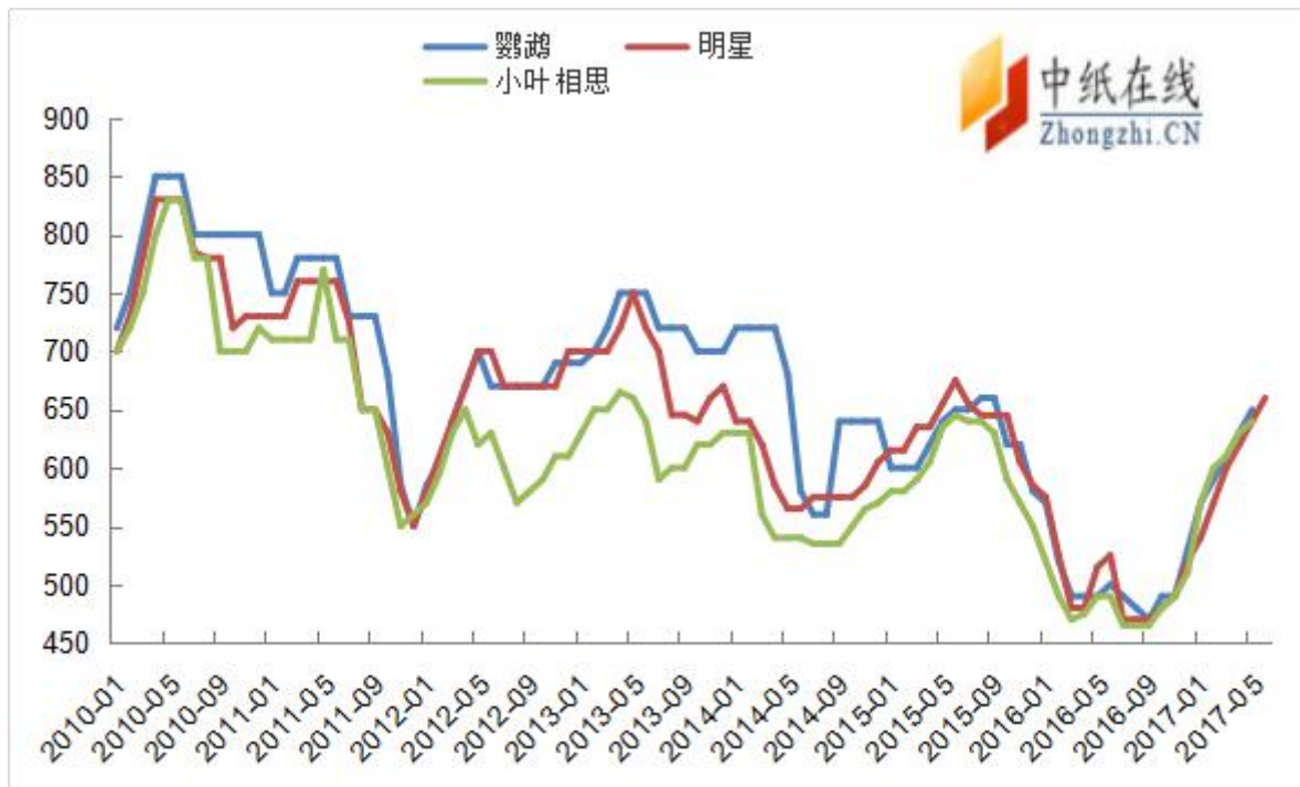
图 6: 2010 年以来阔叶浆报盘走势图 (单位: 美元/吨)