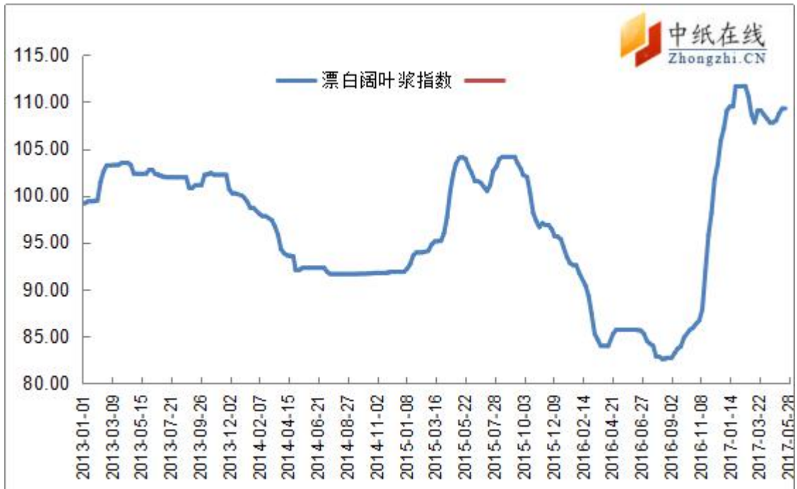
图 8：漂阔浆中纸指数走势图