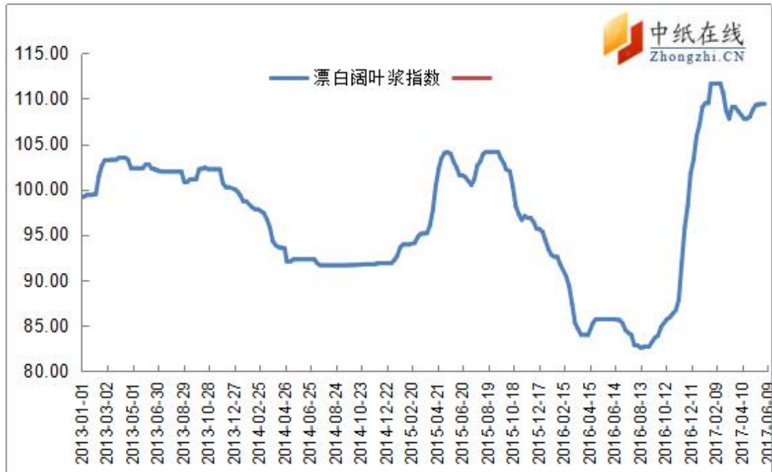
图 2: 进口漂阔浆价格指数走势图