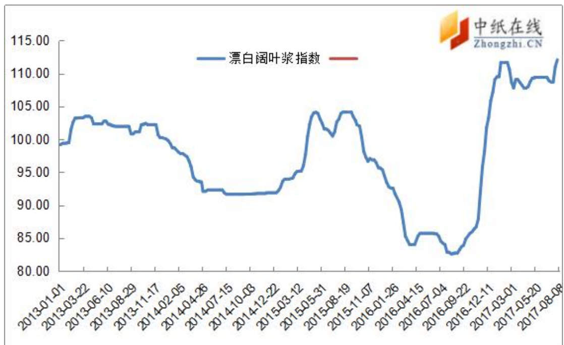
图 2：进口漂阔浆价格指数走势图