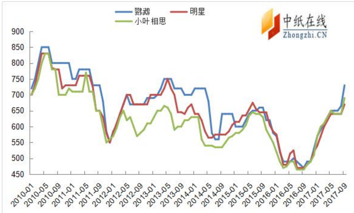
图 6: 2010 年以来阔叶浆报盘走势图 (单位: 美元/吨)