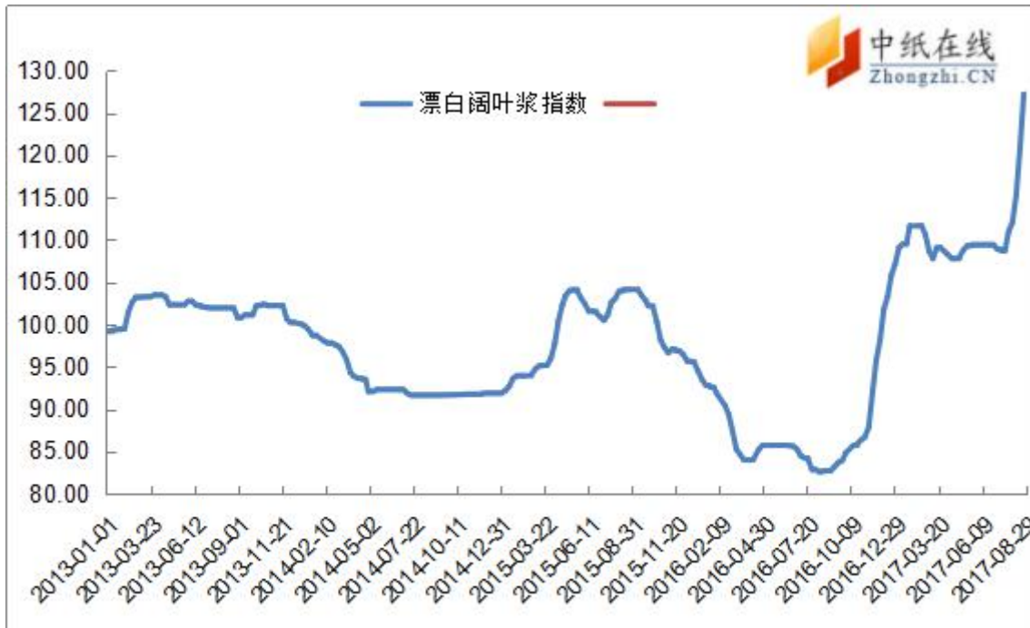
图 8：漂阔浆中纸指数走势图