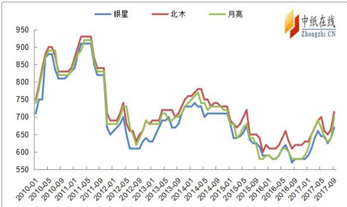
图 5：2010 年以来针叶浆报盘走势图（单位：美元/吨）