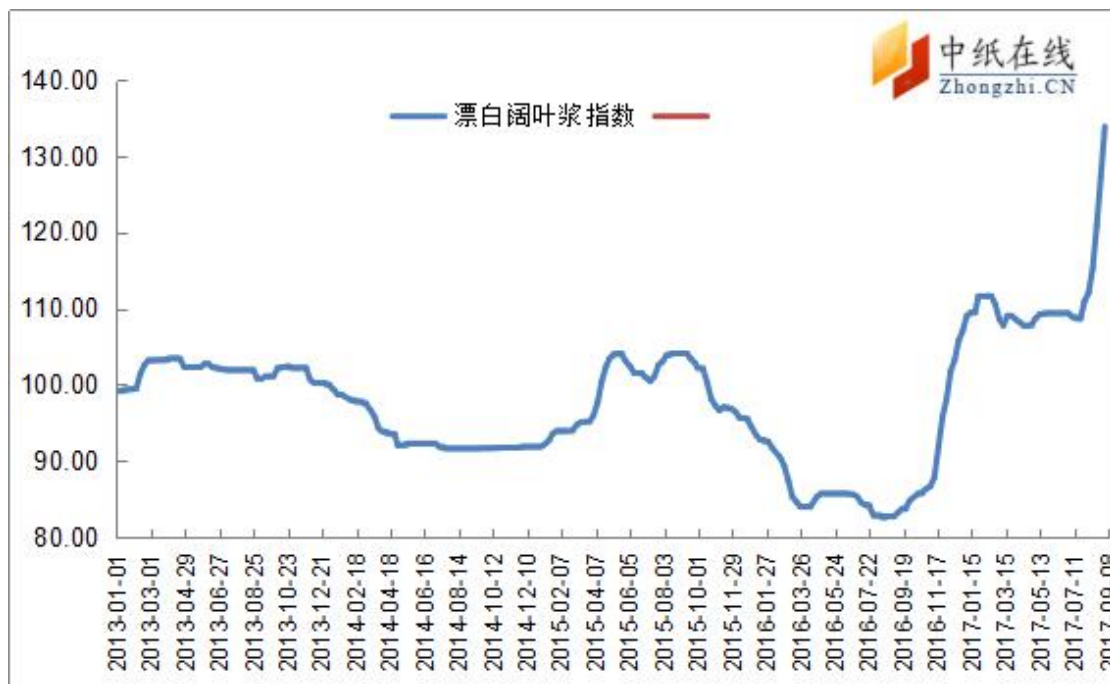
图 2：进口漂阔浆价格指数走势图