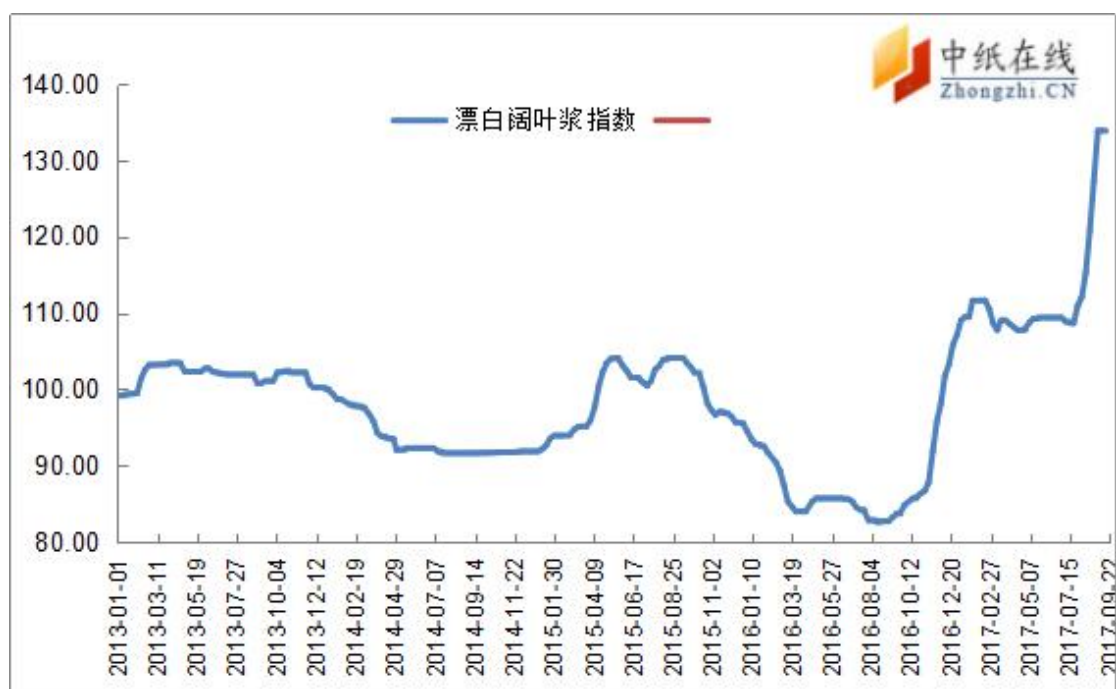
图 2：进口漂阔浆价格指数走势图