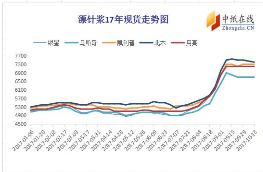
图 3：进口漂针浆现货价格走势