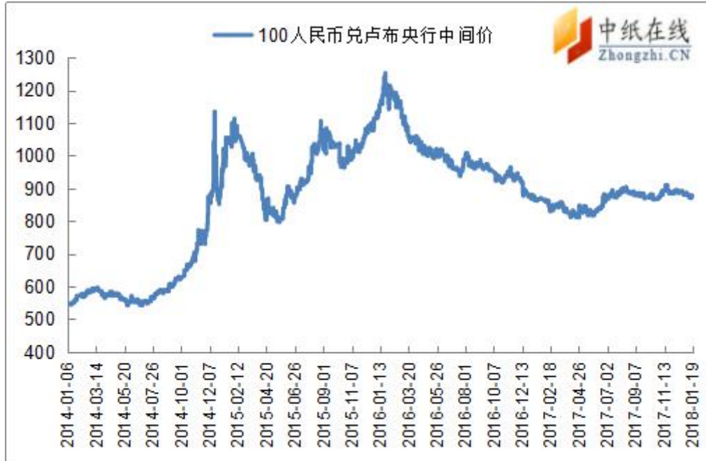
附图 4：人民币兑俄罗斯卢布走势图