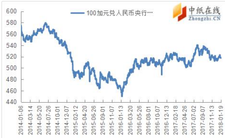
附图 1：加元兑人民币走势图