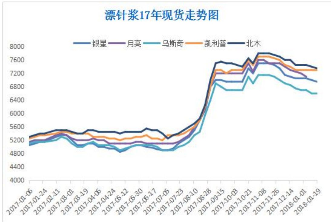
图 3：进口漂针浆现货价格走势