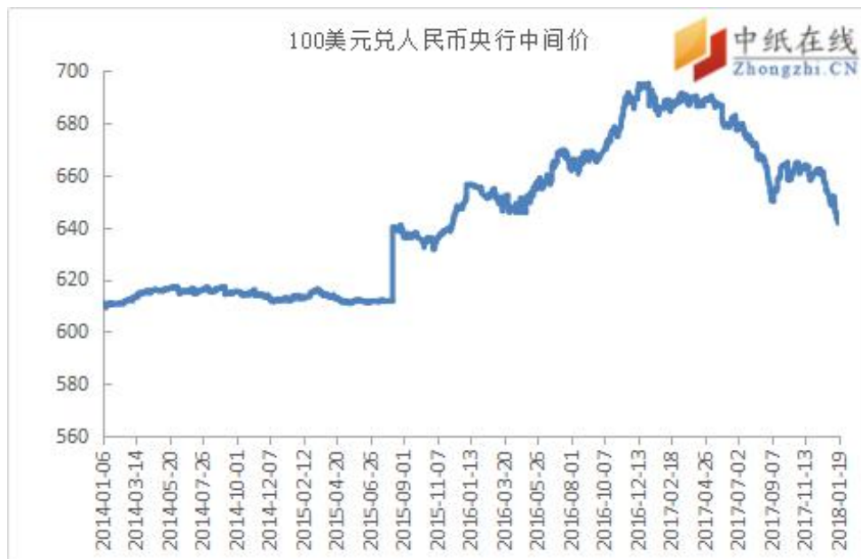
附图 2：美元兑人民币走势图