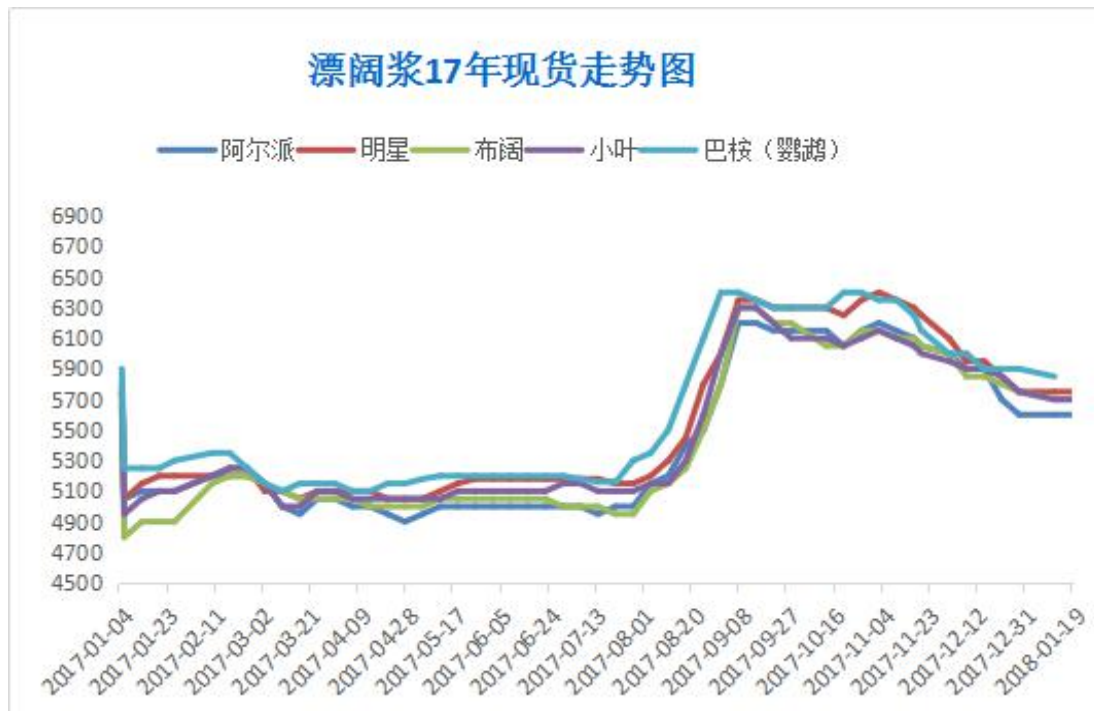
图 4：进口漂针浆现货价格走势