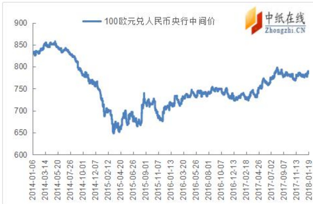
附图 3：欧元兑人民币走势图