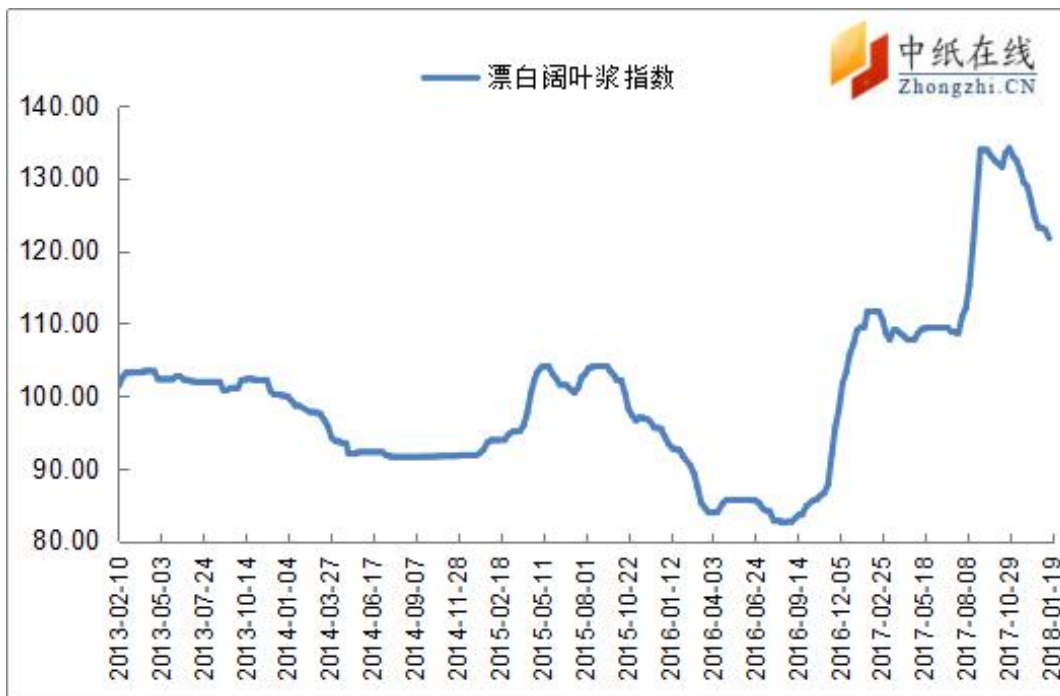
图 2：进口漂阔浆价格指数走势图