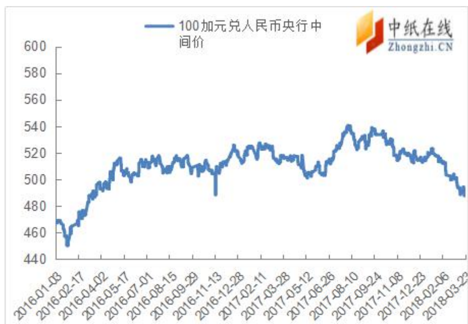
附图 1：加元兑人民币走势图