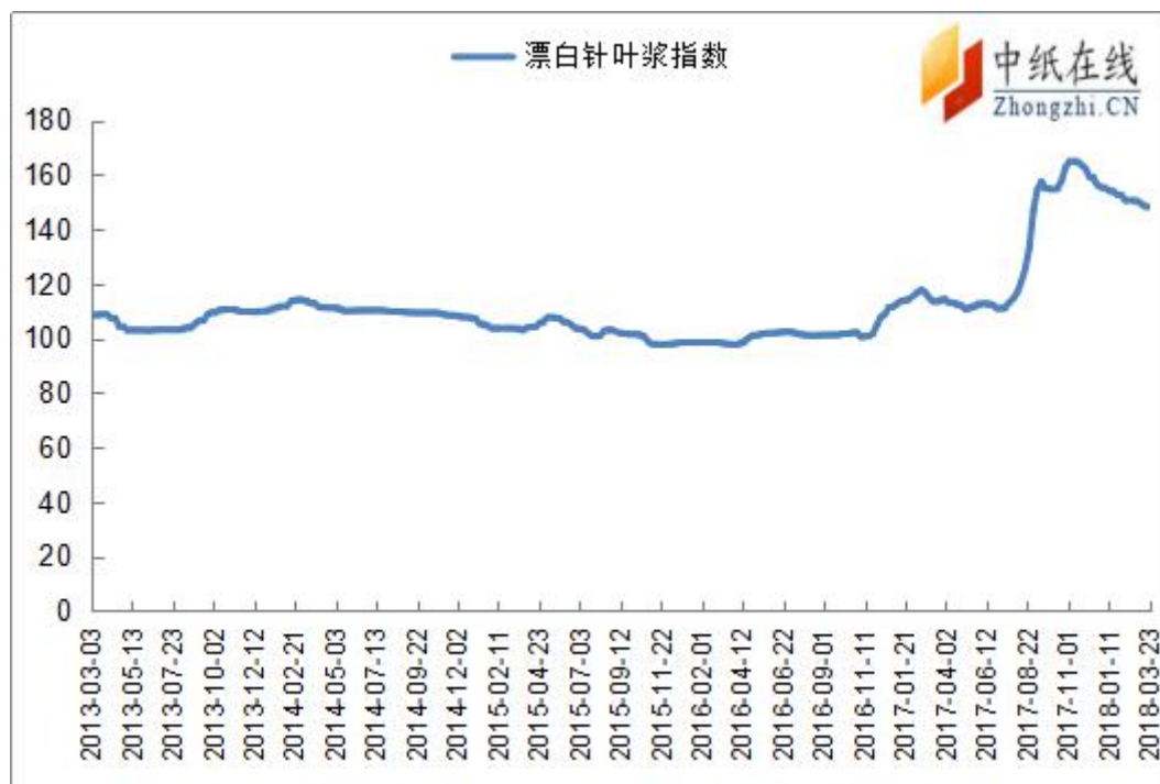
图 1：进口漂针浆价格指数走势图

从中纸指数来看，2018年3月23日，漂针浆中纸指数148.67点，环比上周五下降；漂阔浆中纸指数120.21点，环比上周五上升1.08%。