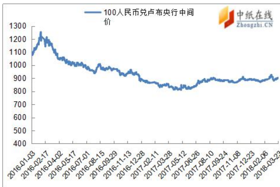
附图 4：人民币兑俄罗斯卢布走势图