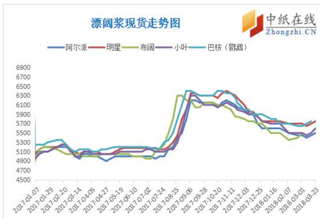
图 4：进口漂针浆现货价格走势