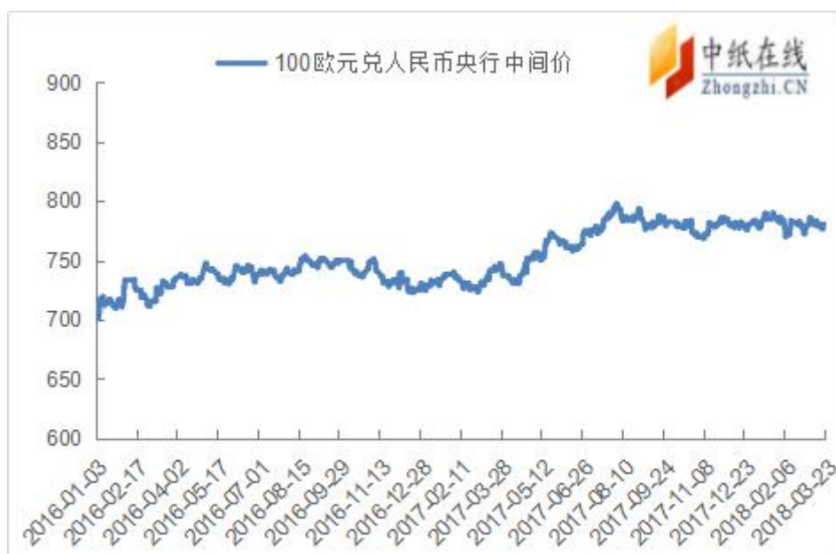
附图 3：欧元兑人民币走势图