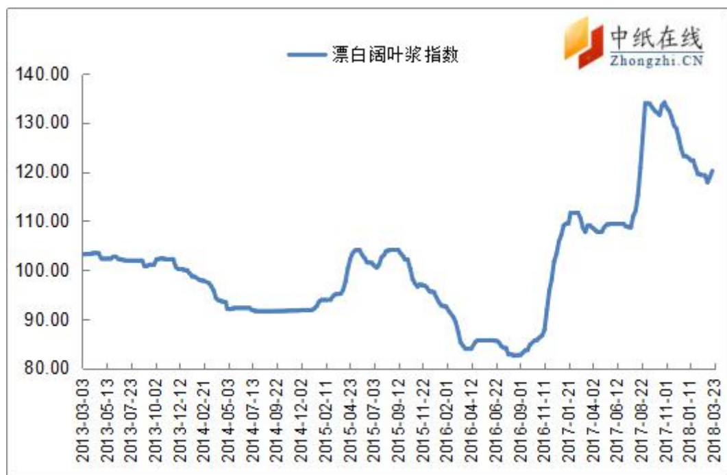
图 2：进口漂阔浆价格指数走势图