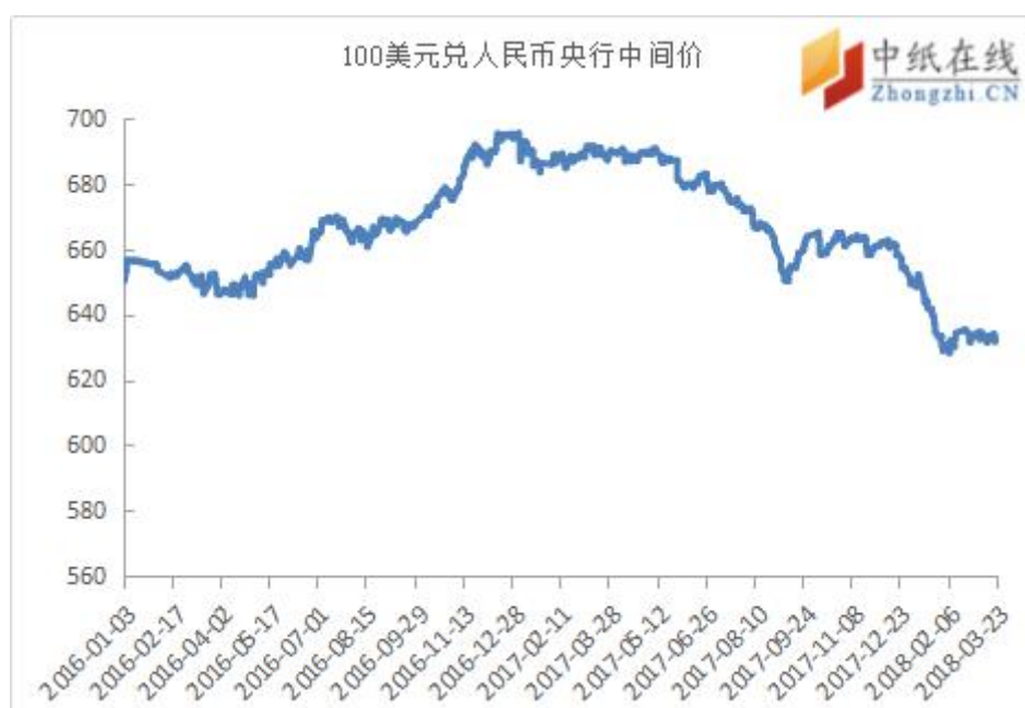
附图 2：美元兑人民币走势图