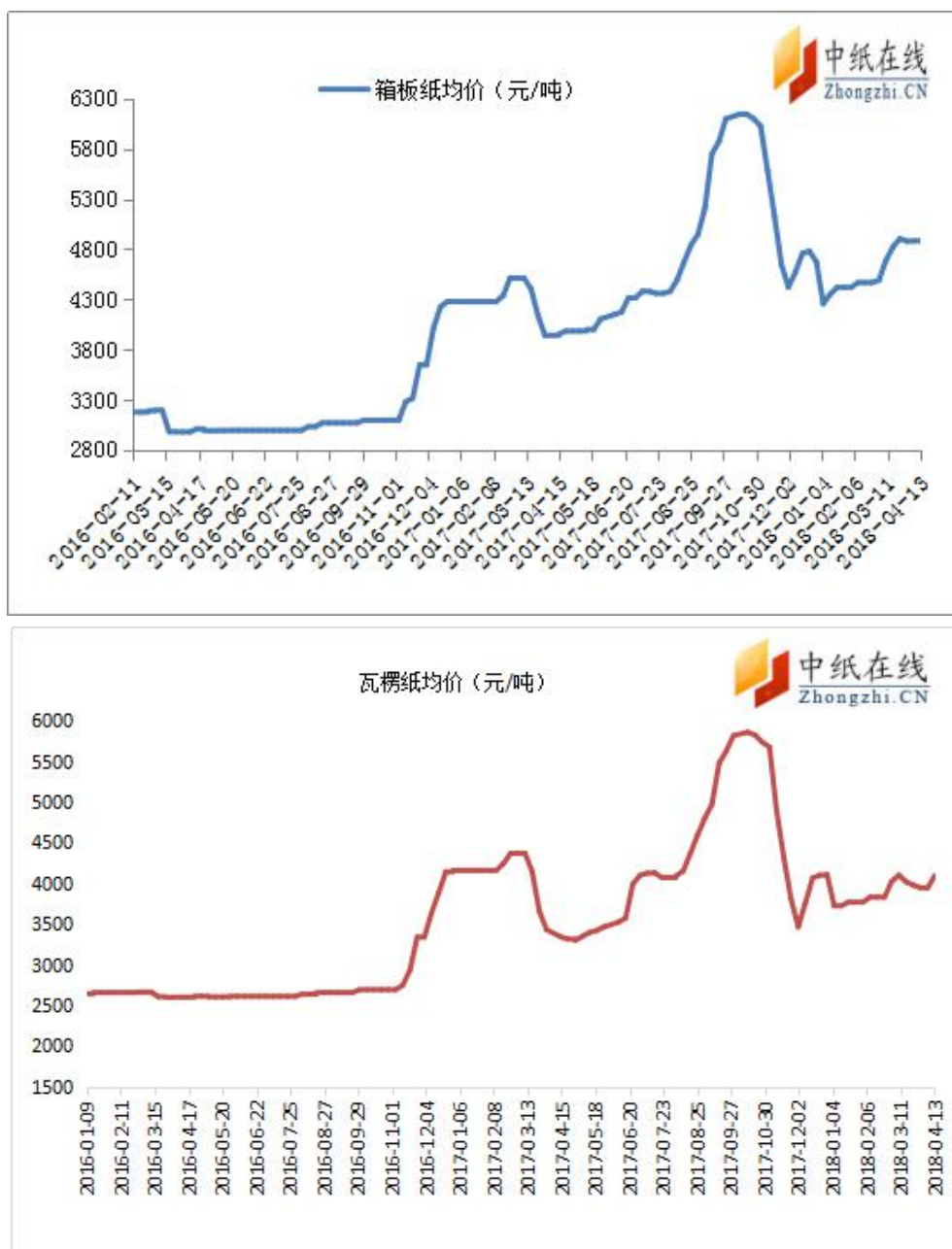
图 5：瓦楞箱板纸均价走势图