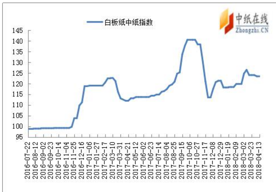
图 3：白板纸中纸指数走势图