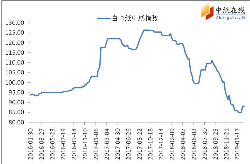
图 1：白卡纸中纸指数走势图