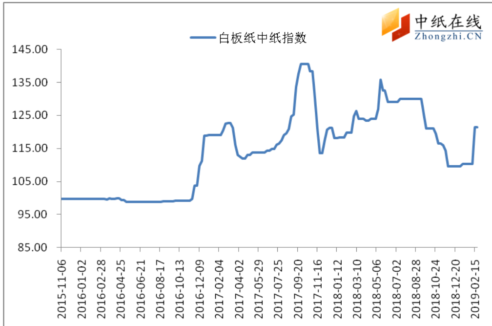
图3：白板纸中纸指数走势图