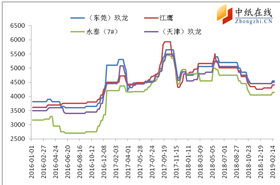
图 4：主流品牌白板纸市场价格走势图