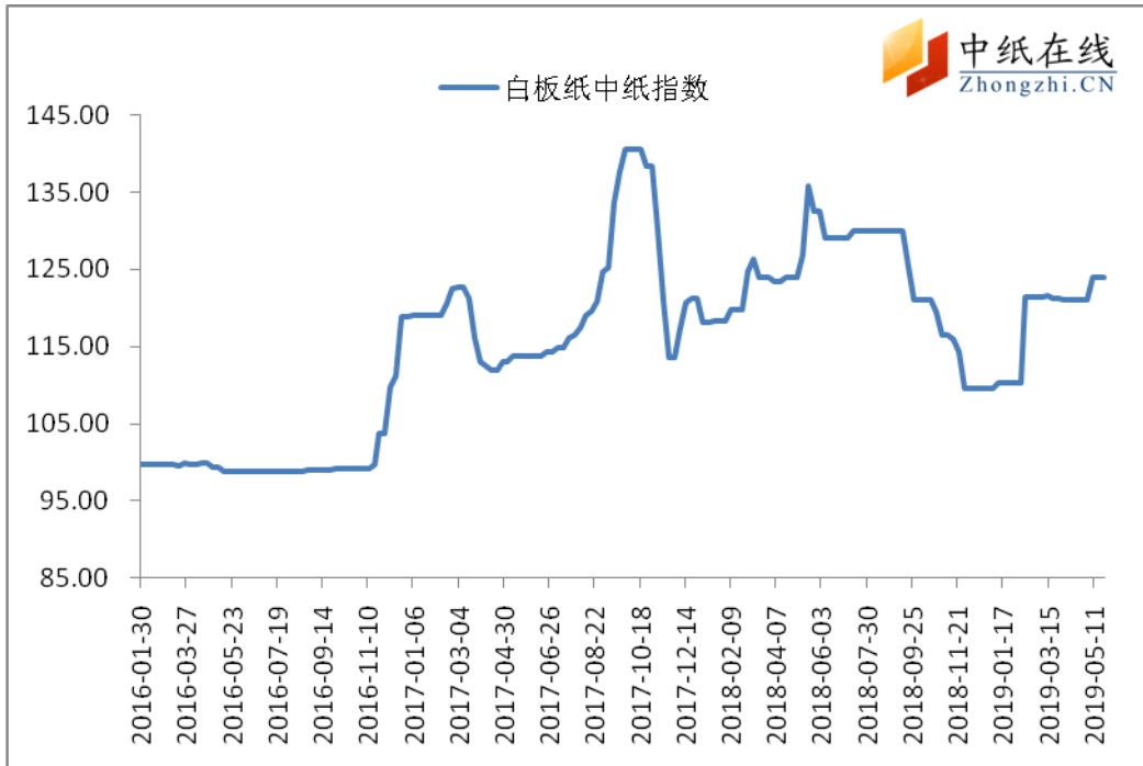
图3：白板纸中纸指数走势图