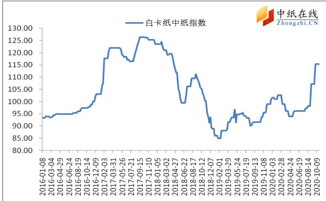
图1：白卡纸中纸指数走势图