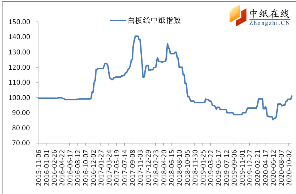
图 3：白板纸中纸指数走势图