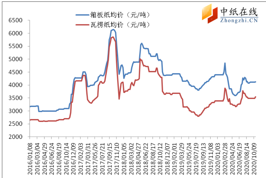
图 5：箱板、瓦楞纸常规克重均价走势图