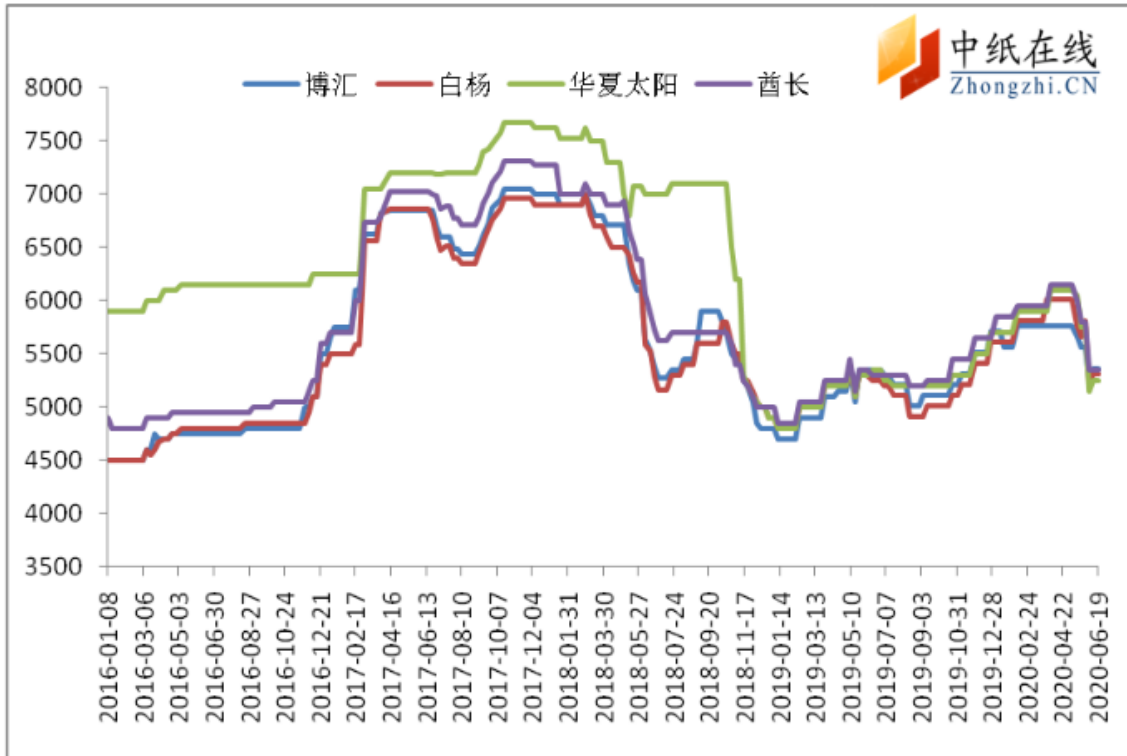
图 2：白卡纸主流品牌市场价格走势图