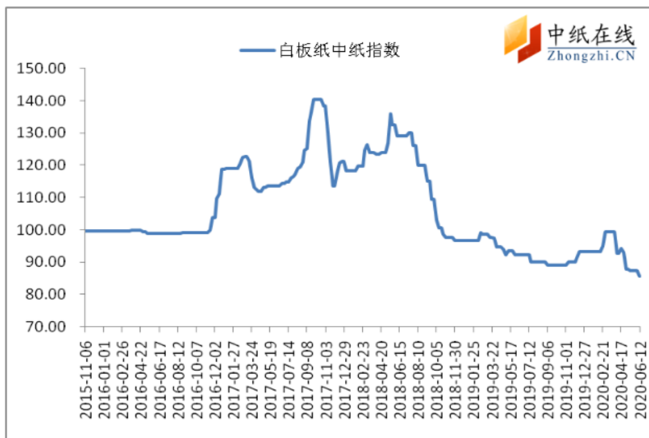
图 3：白板纸中纸指数走势图

2020 年 06 月 19 日白板纸价格指数为 86.33，与上周比增长 0.85。