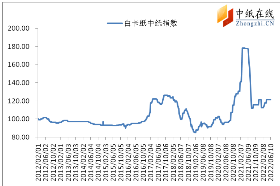
图 1：白卡纸中纸指数走势图