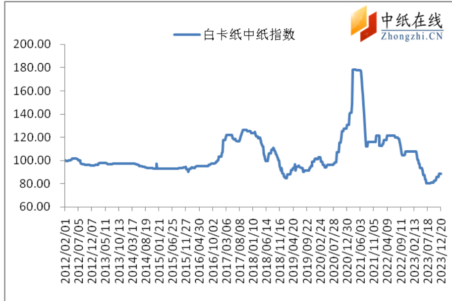
图 1：白卡纸中纸指数走势图