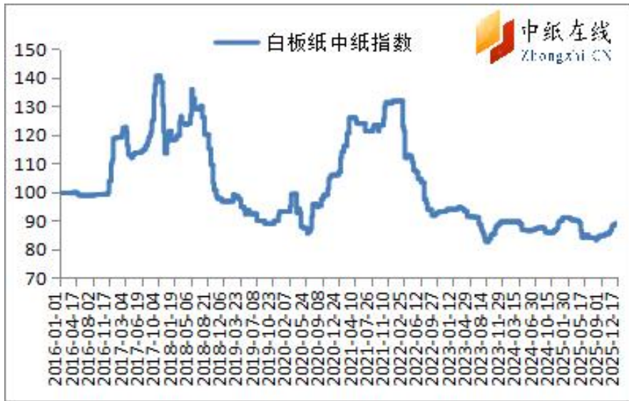
图 3：白板纸中纸指数走势图